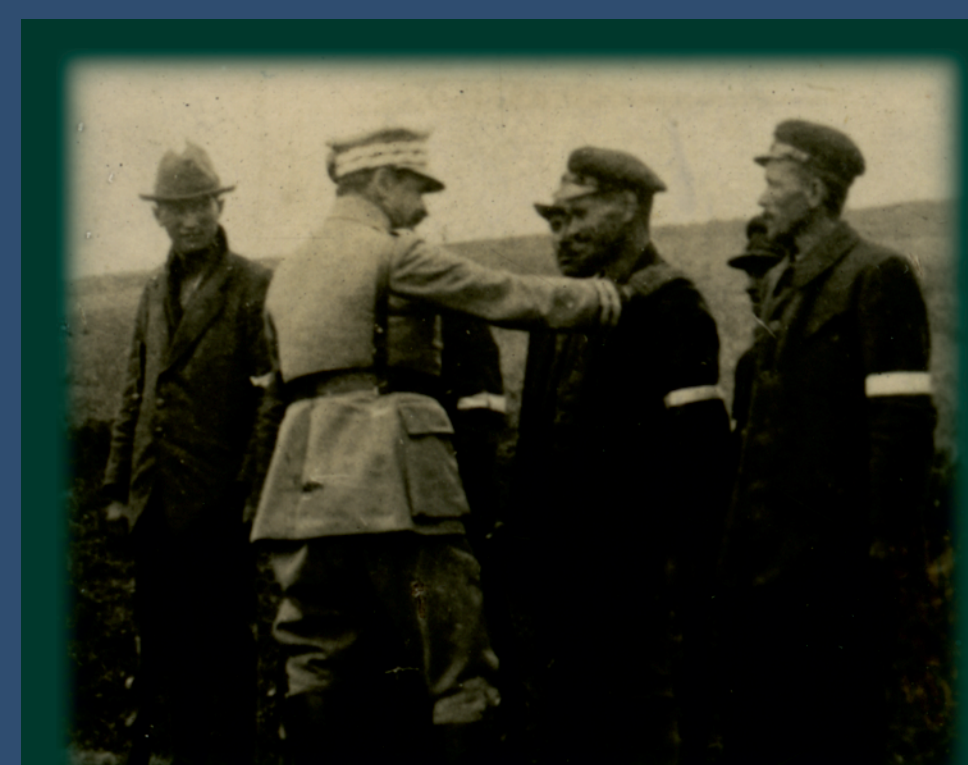
Dowódca Błękitnej Armii oraz frontu południowo-zachodniego gen. Józef Haller w rozmowie z powstańcami-uchodźcami