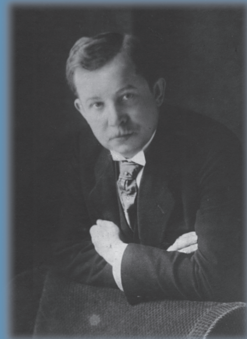
Wojciech Korfanty 1873-1939 Przywódcą polskiego obozu narodowego na Górnym Śląsku