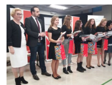
Wernisaż wystawy IPN „Instytut Piłsudskiego w Ameryce - historia i zbiory polskiej instytucji w Nowym Jorku” podczas Festiwalu Niepodległości w Nowym Jorku - 17 listopada 2018