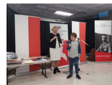
Wernisaż wystawy IPN „Instytut Piłsudskiego w Ameryce - historia i zbiory polskiej instytucji w Nowym Jorku” podczas Festiwalu Niepodległości w Nowym Jorku - 17 listopada 2018