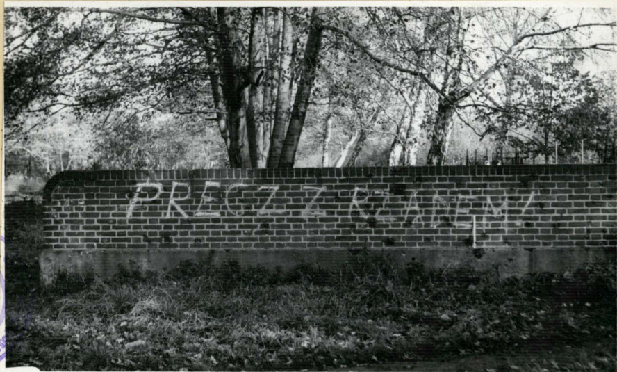
Widok napisu z bliższej odległości, patrz zdjęcie nr. 1.