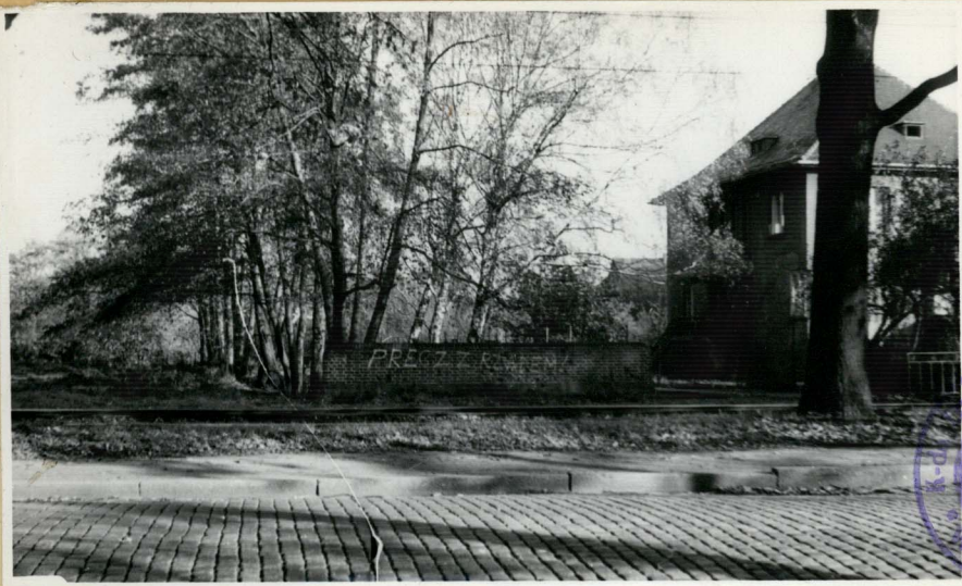
Ogólny widok napisu na murze przy ul. Paśtalowej od strony ul. Olszawskiego.