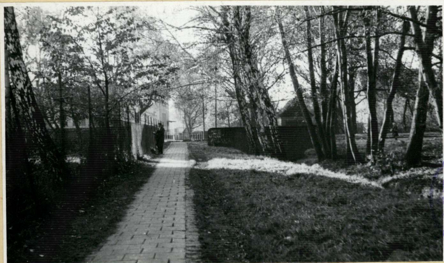
Ogólny widok napisu na murze przy ul. Paśtalowej.