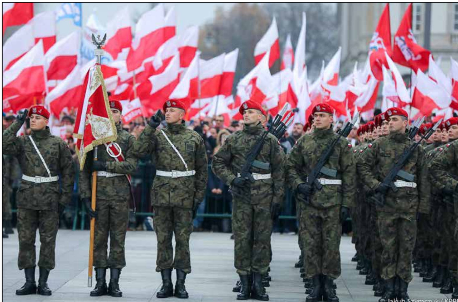
Święto Niepodległości 11 listopada, uroczysta odprawa wart przy Grobie Nieznanego Żołnierza, podniesienie flagi państwowej na maszt i odśpiewanie Hymnu RP

Opracowano na podstawie: Biało-czerwona , oprac. A. Znamierowski, Warszawa 2018 oraz Biało-czerwona i hymn polski , MSWiA 2018.