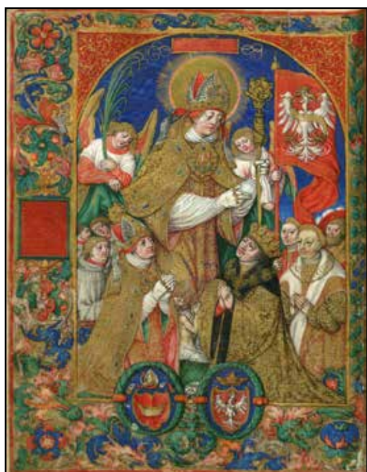
Stanisław Samostrzelnik, Św. Stanisław, biskup krakowski , miniatura, ok. 1530 (domena publiczna)