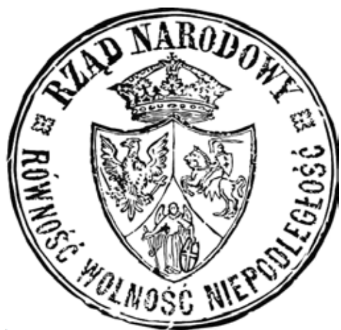
Od góry: herb Rzeczypospolitej z okresu powstania listopadowego [na monecie dwuzłotowej] oraz styczniowego [na pieczęci Rządu Narodowego] (A. Znamierowski, Insygnia, symbole i herby polskie , s. 127)