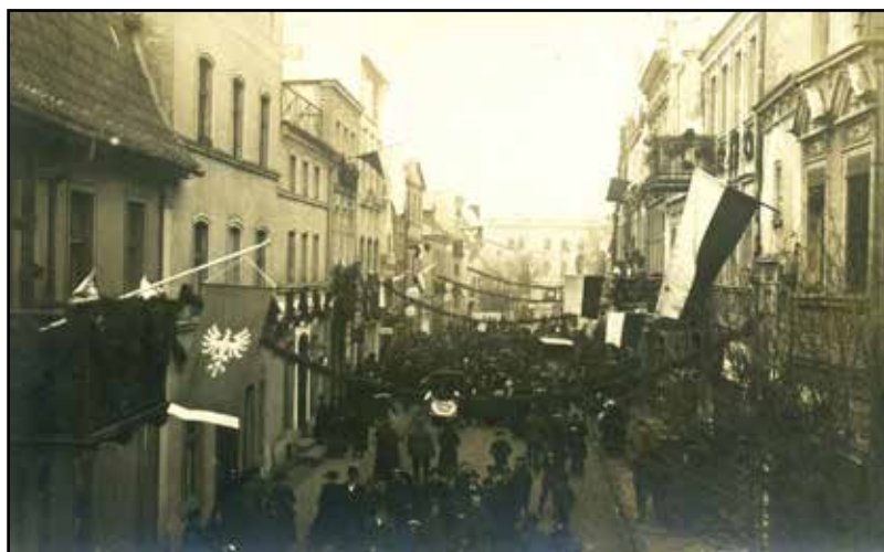
Wkroczenie Wojska Polskiego do Nowego, 25 stycznia 1920 r. (Burmistrz Nowego)