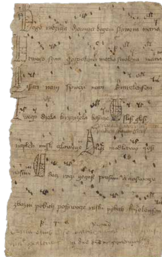
Manuskrypt z tekstem Bogurodzicy (domena publiczna)