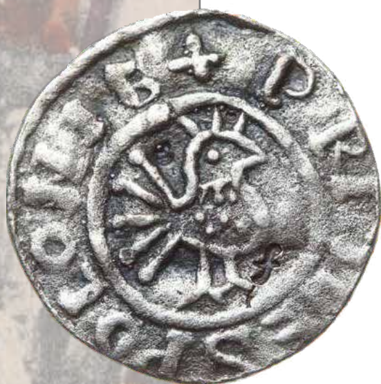
Denar Bolesława Chrobrego (A. Znamierowski, Insygnia, symbole i herby polskie , s. 111)

Po raz pierwszy błędny zapis nazywający herb godłem pojawił się w stalinowskiej konstytucji z 1952 r. i został powielony w ustawie zasadniczej z 1997 r. Błąd w oficjalnym nazewnictwie spowodował rozdzwiek z zasadami heraldyki, dlatego też do dziś wzbudza dyskusje oraz głosy postulujące naprawę tego stanu.