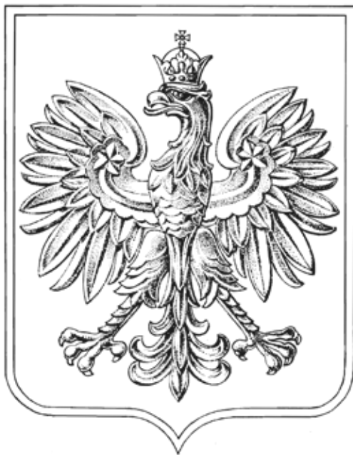
Herb Rzeczypospolitej Polskiej wprowadzony dekretem Prezydenta RP na Uchodźstwie z dnia 11 listopada 1956 r. (Internetowy System Aktów Prawnych: isap.sejm.gov.pl )

Jednocześnie Rząd RP na Uchodźstwie – prawowity rząd, będący kontynuacją władz II Rzeczypospolitej, urzędujący w latach 1940–1990 w Londynie, używał herbu z 1927 r. (w 1956 r. wprowadzono zmianę – zamknięto koronę i zwieńczono ją krzyżem).