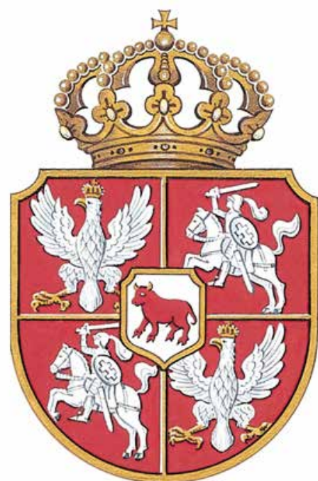
Herb Rzeczypospolitej Obojga Narodów z czasów Stanisława Augusta Poniatowskiego (domena publiczna)