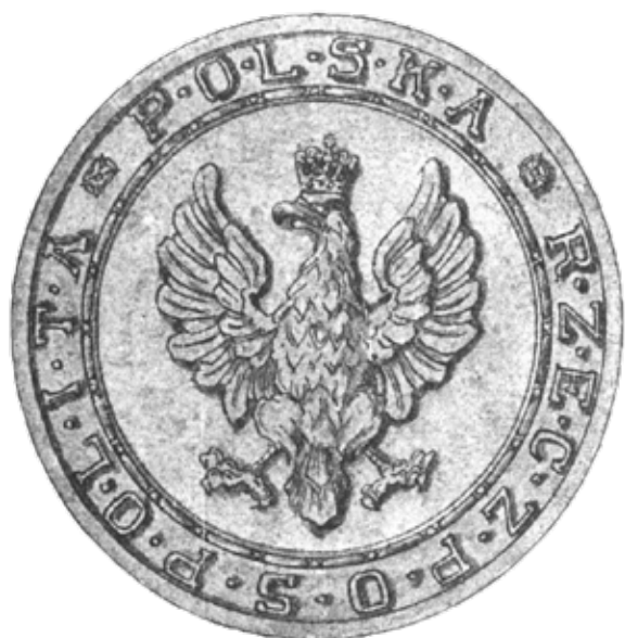
Wzór pieczęci Rzeczypospolitej wprowadzony ustawą z dnia 1 sierpnia 1919 r. (Internetowy System Aktów Prawnych: isap.sejm.gov.pl )

Po odzyskaniu niepodległości w 1918 r. ustawą z 1 sierpnia 1919 r. oficjalnym herbem Rzeczypospolitej Polskiej stał się Orzeł Biały w koronie w czerwonym polu. Przypominał on kształtem polskiego Orła Białego z okresu panowania ostatniego króla Polski, Stanisława Augusta Poniatowskiego – było to nawiązanie do tradycji przedrozbiorowej i wskazanie tym samym na ciągłość państwa polskiego. Orzeł został umieszczony w tarczy francuskiej nowożytnej (prostokątnej, na dole zakończonej jęczyzkiem).