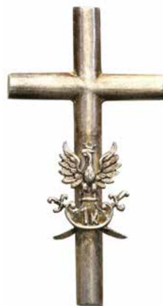
Odznaka pamiątkowa I Korpusu Polskiego (domena publiczna)