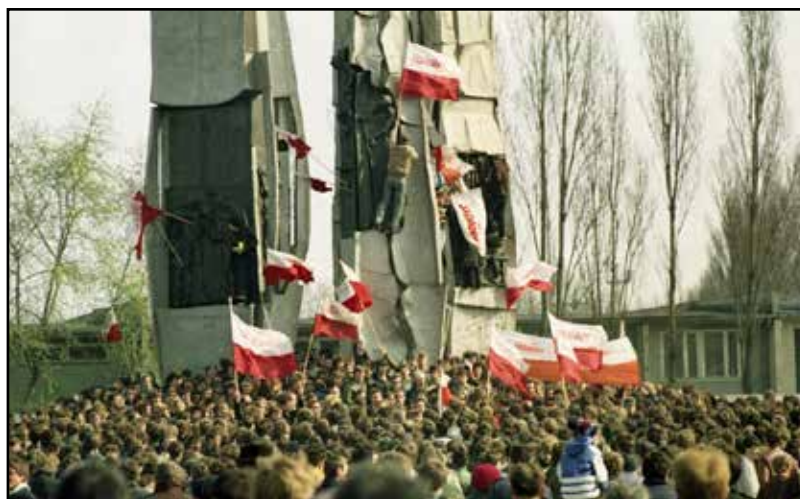
Manifestacja uliczna w Gdańsku, 1 maja 1982 r.