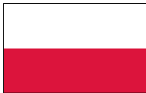
Flaga Polski musi mieć zachowane proporcje 5:8

Inną formą eksponowania barw narodowych są kokardy i wstążki. W kwestii układu barw w kokardzie narodowej istnieją rozbieżności pomiędzy przepisami prawa a zasadami heraldyki. Według zarządzenia Ministra Obrony Narodowej z 2014 r. kokarda składa się z dwóch okręgów: białego centralnego oraz okalającego go czerwonego. Według heraldyków i źródeł ikonograficznych z okresu zaborów układ jest odwrotny.