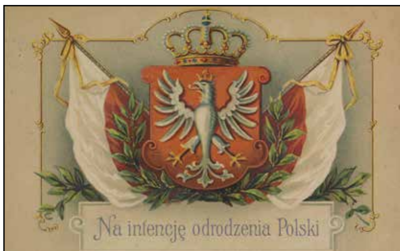
Pocztówka patriotyczna z Orłem Białym, 1917

Dzień Flagi Rzeczypospolitej Polskiej to święto narodowe obchodzone 2 maja.