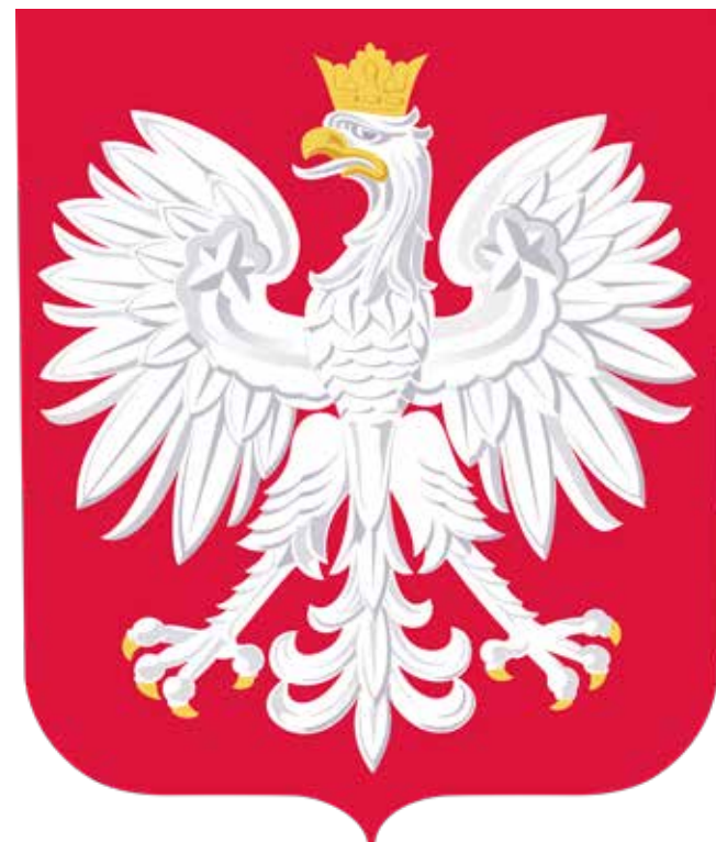
Godło Rzeczypospolitej Polskiej

Orzeł w koronie w tarczy stał się oficjalnym herbem państwa polskiego w XIII w., za panowania króla Przemysła II.