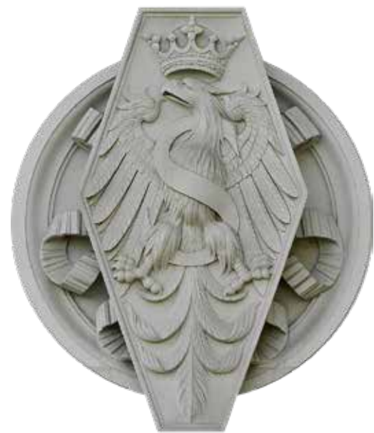
Orzeł z monogramem Zygmunta I Starego na piersi z Kaplicy Zygmuntowskiej na Wawelu (domena publiczna)

Herb Rzeczypospolitej Obojga Narodów z późniejszymi zmianami, takimi jak zastąpienie otwartej korony wieńczącej godło koroną zamkniętą (oznaczającą suwerenność) czy dodanie piątego pola – tarczy sercowej – z herbem osobistym aktualnie panującego króla, był oficjalnym symbolem Rzeczypospolitej do końca XVIII w.