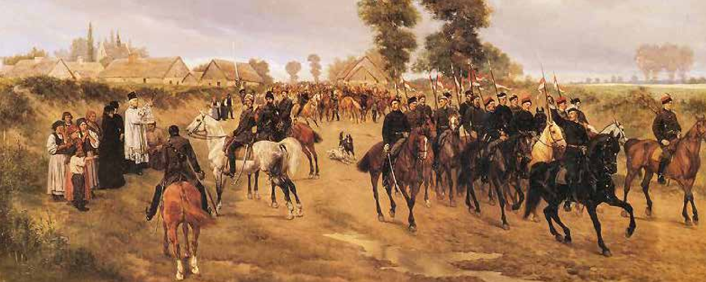
Jan Rosen, Powstańcy z roku 1863, 1880 (Muzeum Narodowe w Krakowie)