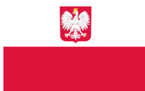
Bandera cywilna i państwowa Polski używana jest przez przedstawicielstwa dyplomatyczne, lotniska cywilne, kapitanaty portów oraz na statkach morskich

Rozmieszczenie barw pól szachownicy używanej od 1993 r. pozostaje w sprzeczności z tradycją – początkowo ułożenie pól na szachownicy odzwierciedlało kolory tarcz herbu Rzeczypospolitej Obojga Narodów.