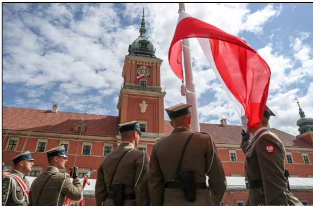
Obchody Narodowego Święta 3 Maja, podniesienie flagi państwowej na maszt i odśpiewanie Hymnu RP