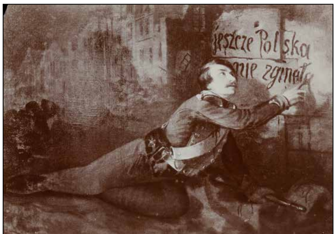
Charles Michel Guilbert d'Anelle, Varsovie. Épisode en 1831 („Umierający żołnierz wolności”), 1849 (domena publiczna)