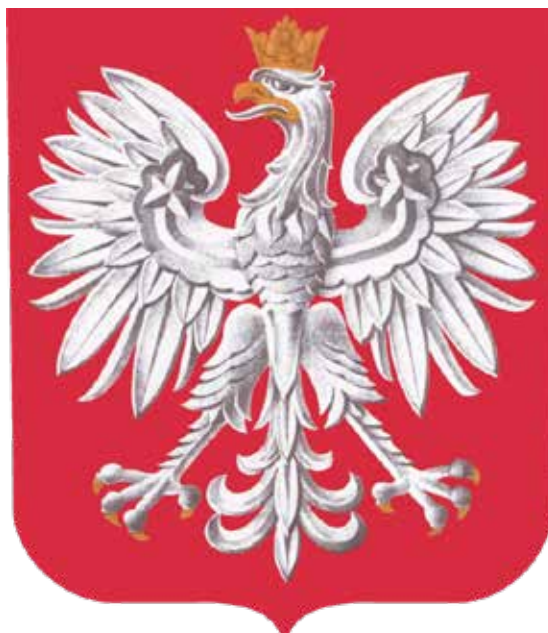
Herb Rzeczypospolitej Polskiej wprowadzony na mocy ustawy z dnia 9 lutego 1990 r. (Internetowy System Aktów Prawnych: isap.sejm.gov.pl )

Dopiero po przemianach politycznych w 1989 r. Orłu Białemu przywrócono jego złotą koronę. Nowy herb, obowiązujący do dnia dzisiejszego, wprowadzono na mocy ustawy z 9 lutego 1990 r., wykorzystując nieznacznie zmieniony projekt z 1927 r. (m.in. zlikwidowano złotą bordiurę tarczy).