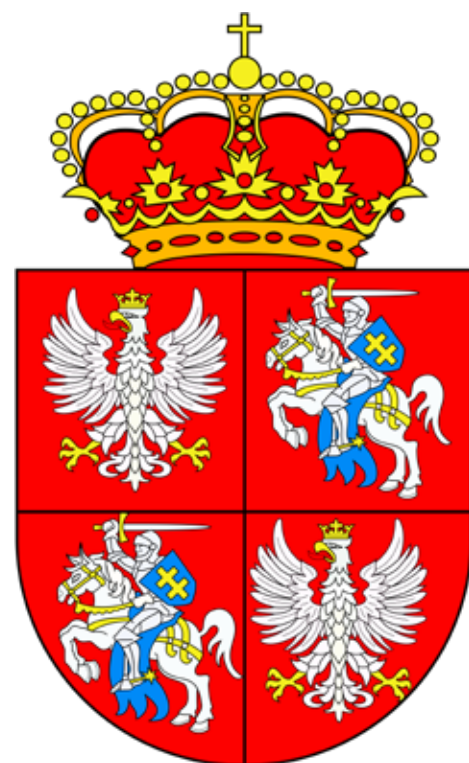
Herb Rzeczypospolitej Obojga Narodów (domena publiczna)