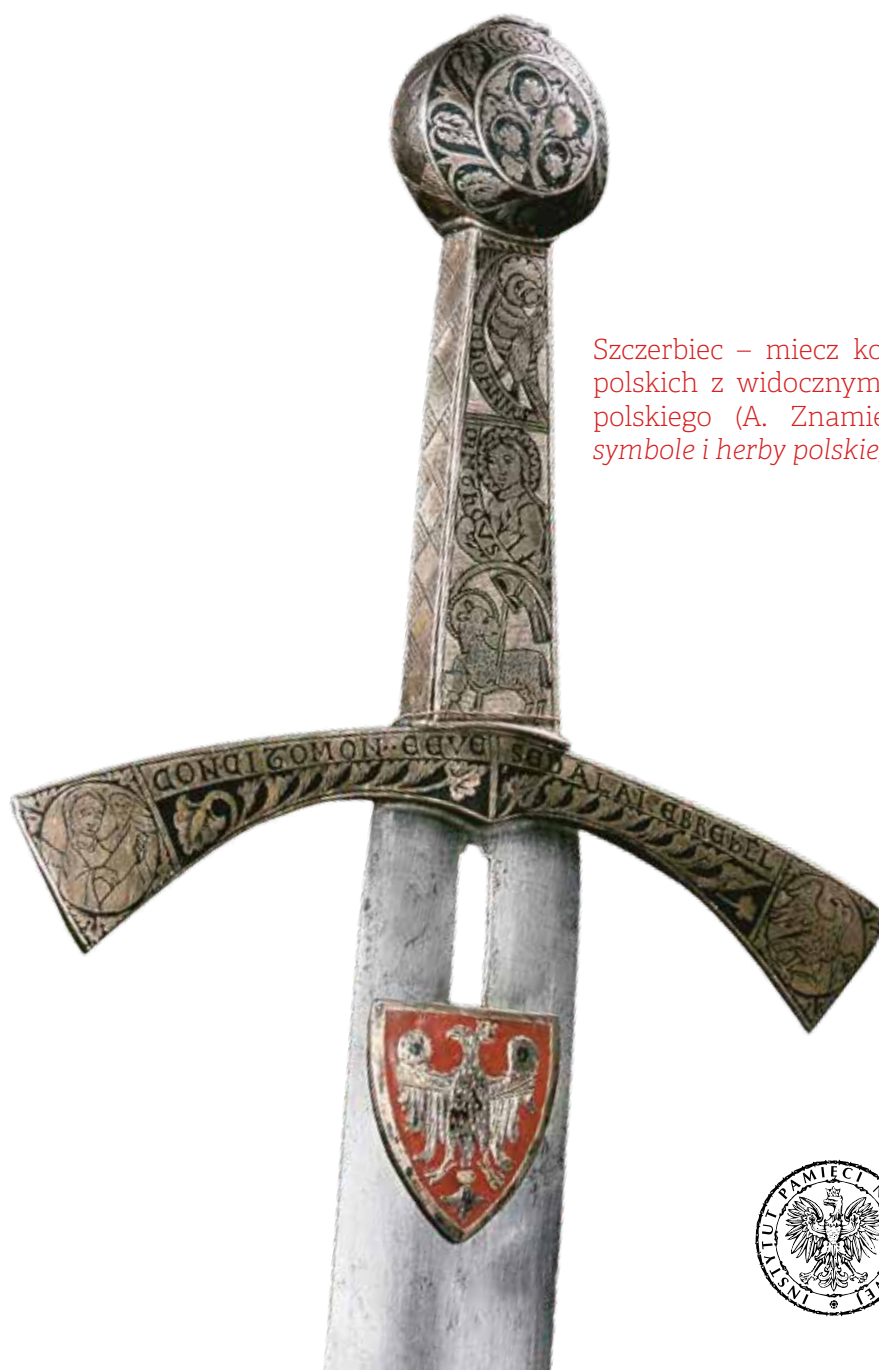
Szczerbiec – miecz koronacyjny królów polskich z widocznym herbem państwa polskiego (A. Znamierowski, Insygnia, symbole i herby polskie , s. 10)