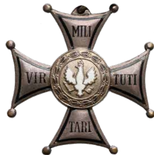
Krzyż Srebrny (V klasy) Orderu Virtuti Militari. Order ustanowił Stanisław August Poniatowski w 1792 r. po bitwie pod Zieleńcami. W 1919 r. nadano mu nazwę Orderu Wojskowego Virtuti Militari. Do dnia dzisiejszego jest to najwyższe polskie odznaczenie wojskowe

Orzeł na blachach kaszkieców i oficerskich ryngrafach stał się elementem umundurowania wojskowego jeszcze w XVIII w., kiedy kształtował się polski mundur narodowy. Jako symbol Wojska Polskiego był używany w czasach Księstwa Warszawskiego. Kontynuując tę tradycję, pod symbolem Orła o niepodległość Polski w czasie I wojny światowej walczyły Legiony Polskie, Błękitna Armia czy Korpusy Polskie w Rosji.