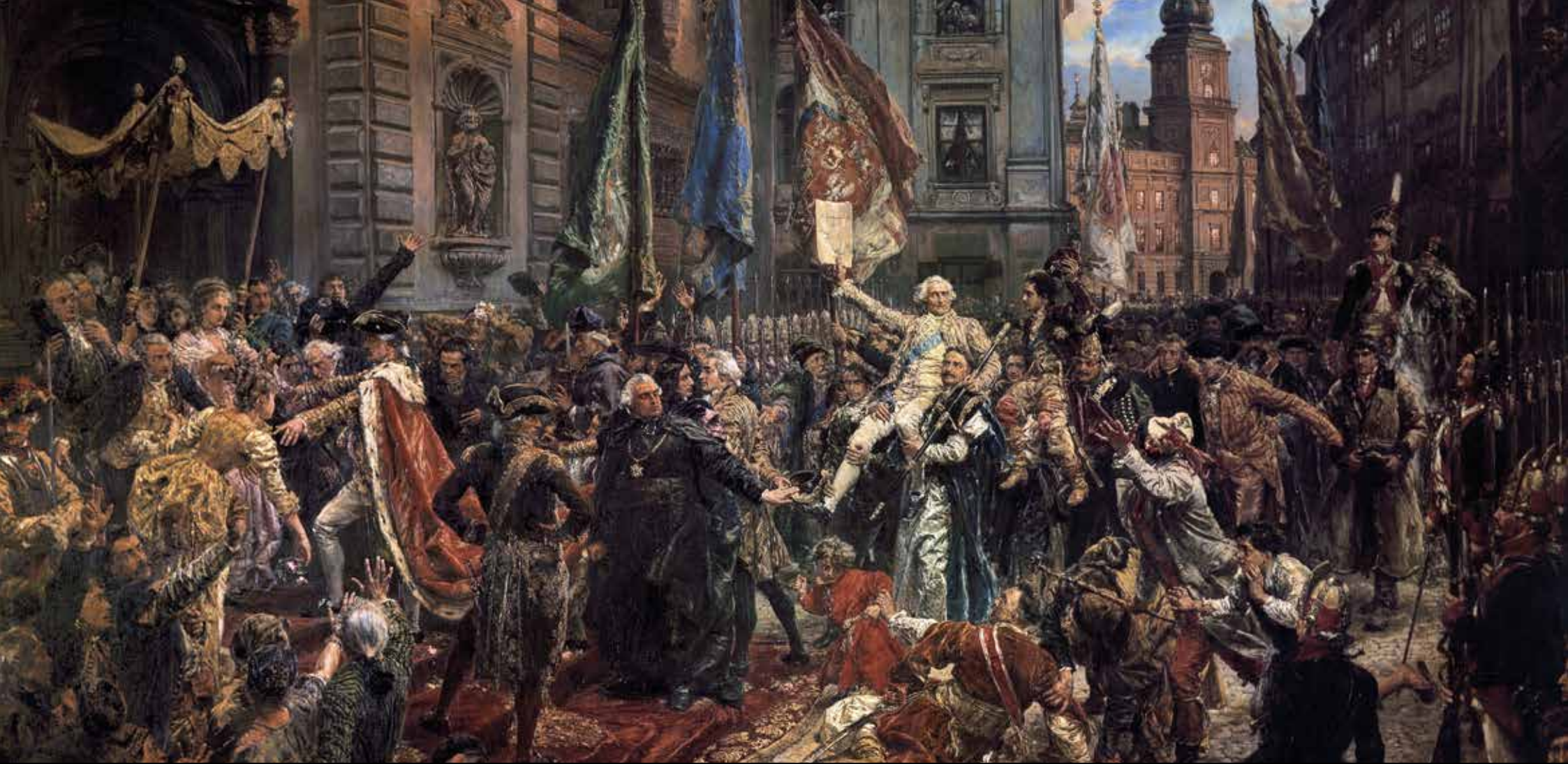
Jan Matejko, Konstytucja 3 Maja 1791 roku , 1891 (domena publiczna)