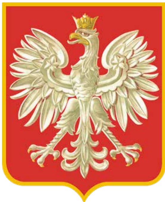
Herb Rzeczypospolitej Polskiej wprowadzony na mocy rozporządzenia z dnia 13 grudnia 1927 r. (Internetowy System Aktów Prawnych: isap.sejm.gov.pl )

W 1927 r. podjęto decyzję o zmianie wzoru herbu Rzeczypospolitej. Nowy projekt nawiązywał bezpośrednio do Orła Białego z czasów Stefana Batorego.