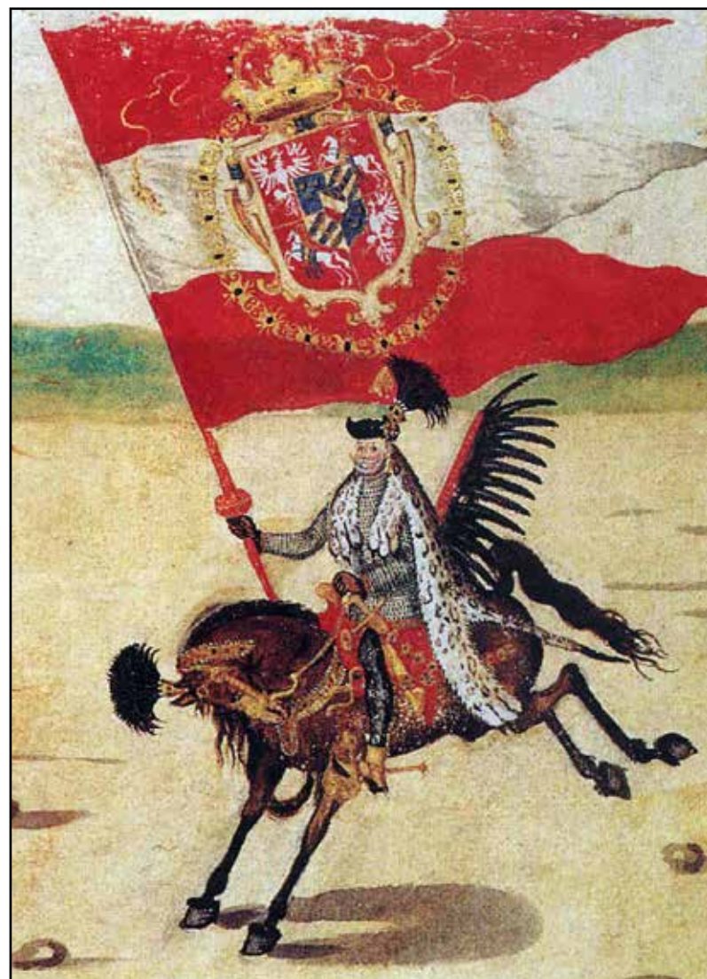
Chorąży z chorągwią króla Zygmunta III Wazy, fragment tzw. rolki sztokholmskiej, XVII w.

Warto podkreślić, że czerwień od najdawniejszych czasów była zarezerwowana dla władców, rycerzy i magnaterii – karmazynowe szaty jako synonim władzy, bogactwa i dostojności mogli nosić tylko ludzie uprzywilejowani. Biel była z kolei wykorzystywana w formie rozet na kapeluszach Wojska Polskiego w trakcie panowania Augusta II Mocnego. Kokardy (rozety) biało-czerwone pojawiły się za czasów Stanisława Augusta Poniatowskiego, ostatniego króla Polski.