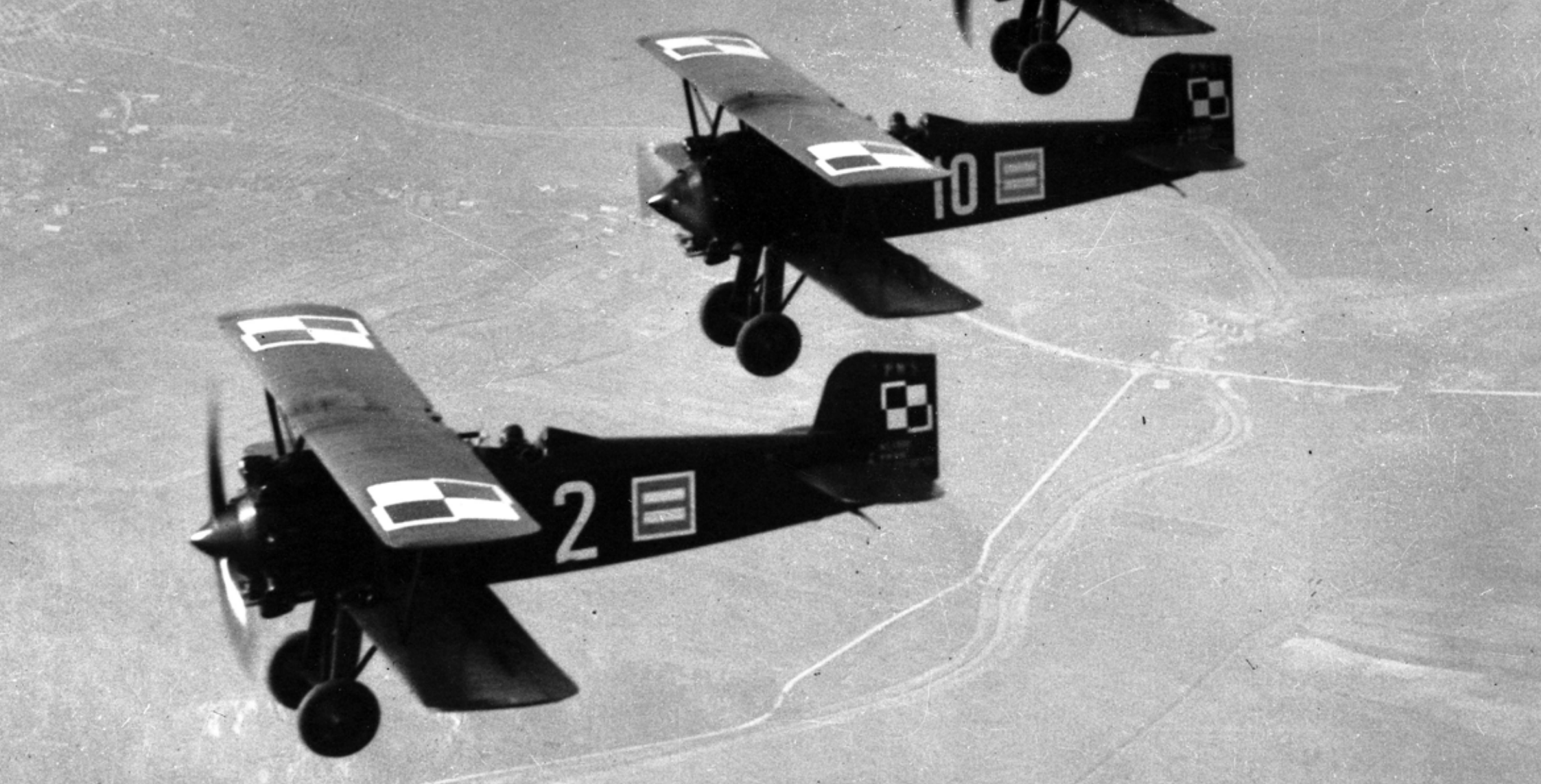
Samoloty PWS-A podczas defilady trzeciomajowej w Krakowie, 1932 r.