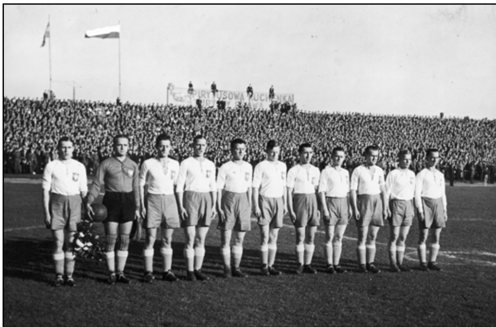
Mecz piłki nożnej Polska – Jugosławia na Stadionie Wojska Polskiego im. marszałka Józefa Piłsudskiego w Warszawie, 1938 r.

Mazurek Dąbrowskiego za hymn narodowy został oficjalnie uznany w lutym 1927 r. i pozostał nim do dnia dzisiejszego.