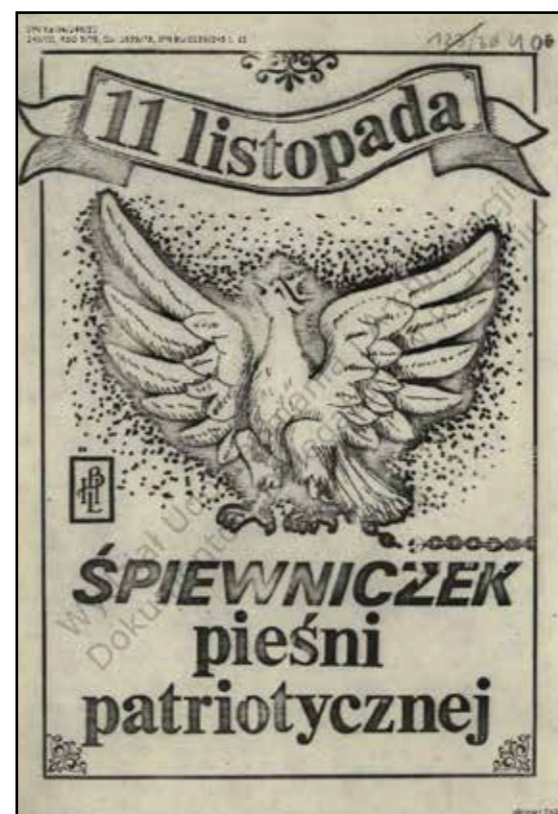
Śpiewniczek pieśni patriotycznej , wydawnictwo podziemne, 1981 (Archiwum IPN)