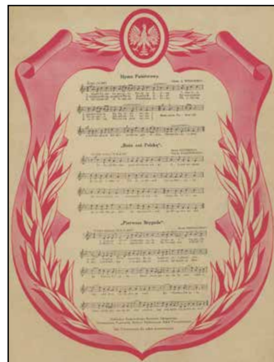
Hymn państwowy i pieśni narodowe z zapisem nutowym. Dar Towarzystwa Popierania Budowy Publicznych Szkół Powszechnych (Biblioteka Narodowa)