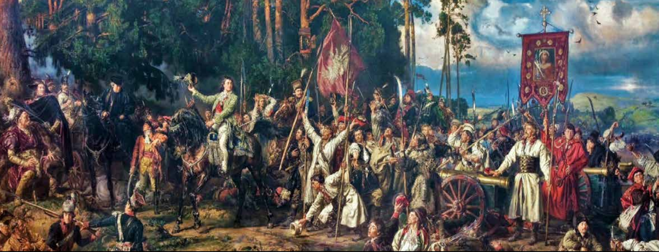
Jan Matejko, Kościuszko pod Racławicami, 1888

Symbolami narodowymi Rzeczypospolitej Polskiej są: godło – Orzeł Biały, barwy biało-czerwone oraz hymn – Mazurek Dąbrowskiego . Zapisy na temat symboli znajdują się w Konstytucji RP oraz Ustawie o godle, barwach i hymnie Rzeczypospolitej Polskiej oraz o pieczęciach państwowych.