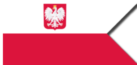
Bandera wojenna Rzeczypospolitej Polskiej