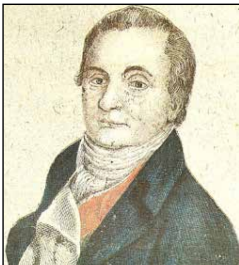
Portret Józefa Wybickiego (domena publiczna) oraz manuskrypt słów Pieśni Legionów Polskich we Włoszech (domena publiczna)

Pieśń na melodię mazurka za pośrednictwem emisariuszy trafiła do pozostającej pod zaborami Polski – śpiewano ją w trakcie kampanii napoleońskiej oraz powstań listopadowego i styczniowego.