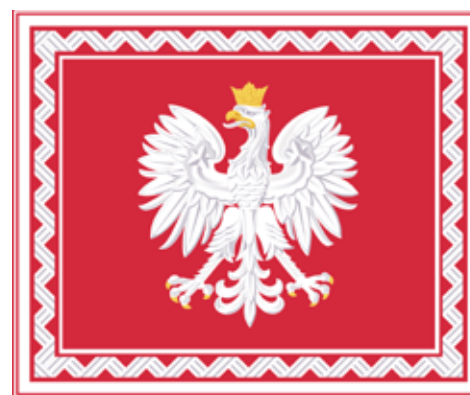
Proporzec Prezydenta Rzeczypospolitej Polskiej