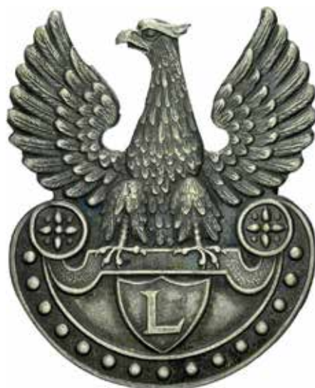
Orzeł Legionów Polskich