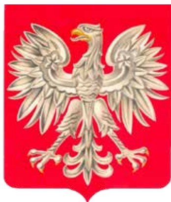
Herb PRL wprowadzony dekretem z dnia 7 grudnia 1955 r. (Internetowy System Aktów Prawnych: isap.sejm.gov.pl )

Po zakończeniu II wojny światowej władze komunistyczne zależne od sowieckiej Rosji pozbawiły polskiego orła jego wielowiekowego atrybutu – korony. Dla większości Polaków akt ten symbolizował zniewolenie narodu.