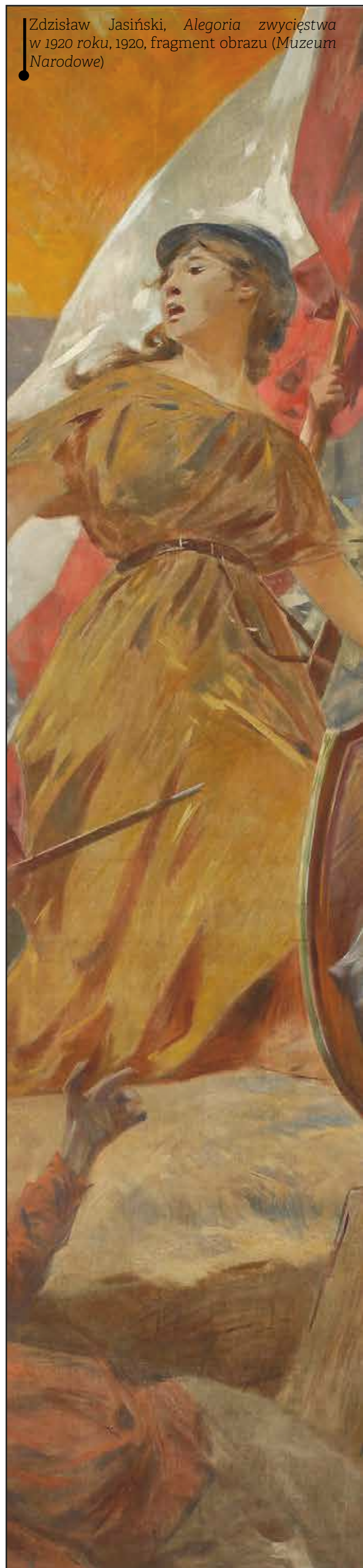
Zdzisław Jasiński, Alegoria zwycięstwa w 1920 roku, 1920, fragment obrazu (Muzeum Narodowe)