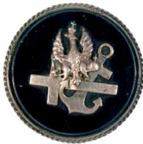
Srebrna broszka z okresu powstania styczniowego (Muzeum Wojska Polskiego)

Od końca XVIII w., kiedy państwa zaborcze – Rosja, Prusy i Austria – doprowadziły do upadku Rzeczypospolitej, wizerunek orła wyobrażał ciągłość państwa polskiego. Pod jego symbolem Polacy stawali do walki z zaborcami w kolejnych powstaniach narodowych. Orła umieszczano na herbach z okresu powstania listopadowego (1830–1831) i styczniowego (1863–1864), biżuterii patriotycznej oraz pocztówkach.