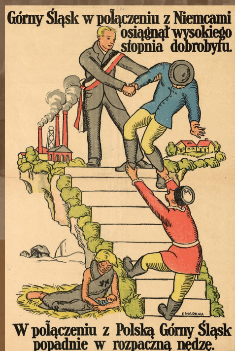
Niemiecki plakat propagandowy