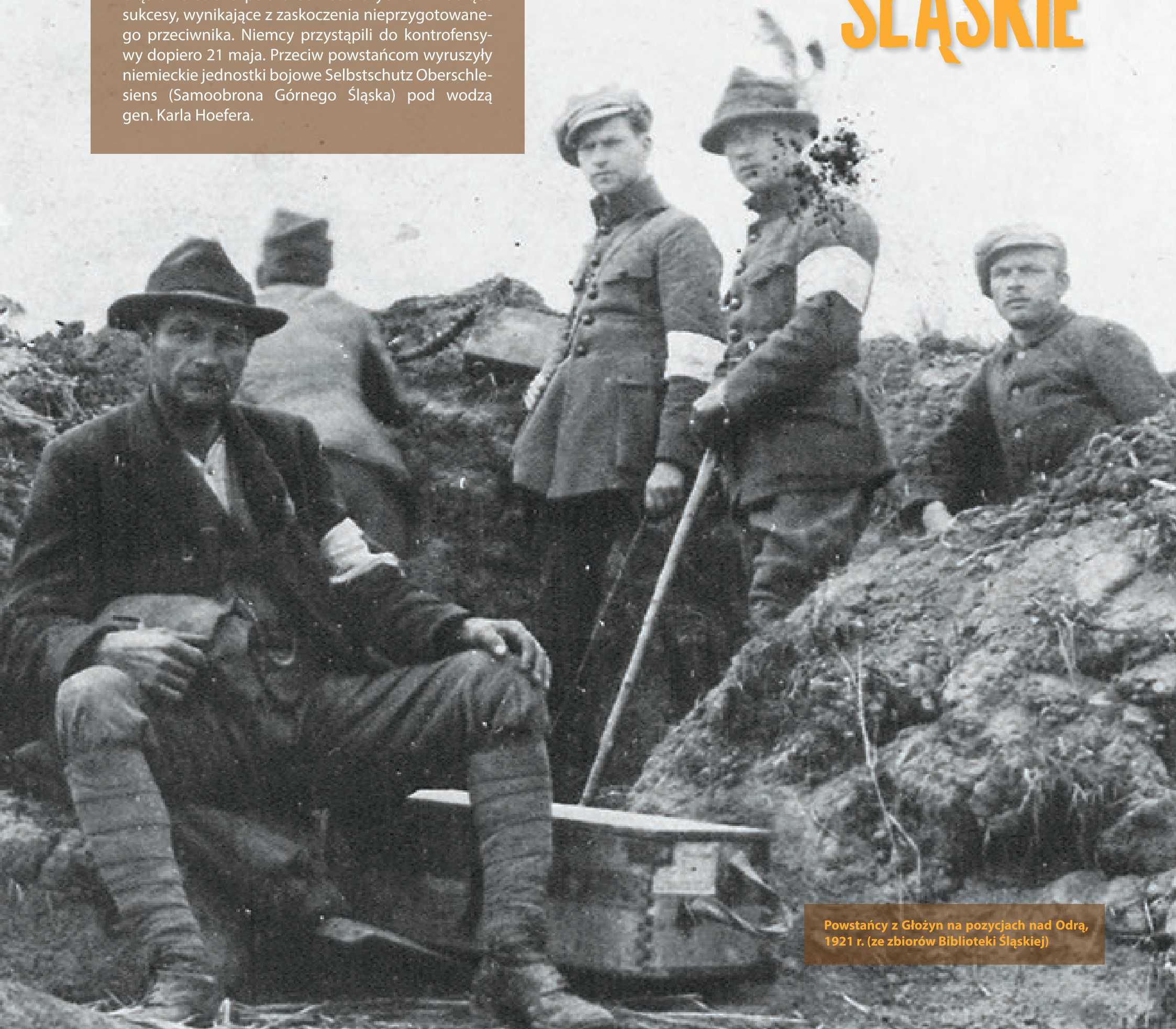
Powstańcy z Głóżyn na pozycjach nad Odrą, 1921 r.

Siły niemieckie wahały się między 30 a 40 tys. żołnierzy. W pierwszych dniach walk powstańcy pokonali oddziały niemieckiej Organizacji Bojowej Górnego Śląska. Później siły niemieckie zostały znacząco wzmocnione przez dobrze uzbrojone oddziały ochotników przybyłych z Rzeszy, tzw. Freikorpsy. Na zdjęciu oddział Selbstschutzu