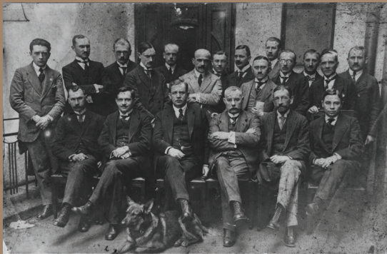
W Polskim Komisariacie Plebiscytowym w Bytomiu zatrudnionych było ok. 1000 osób. Kolejne tysiące pracowników działało w terenie, w komitetach powiatowych, gminnych i miejskich. Na zdjęciu Wojciech Korfanty (siedzi trzeci od lewej) w gronie współpracowników w Bytomiu, 1920 r.