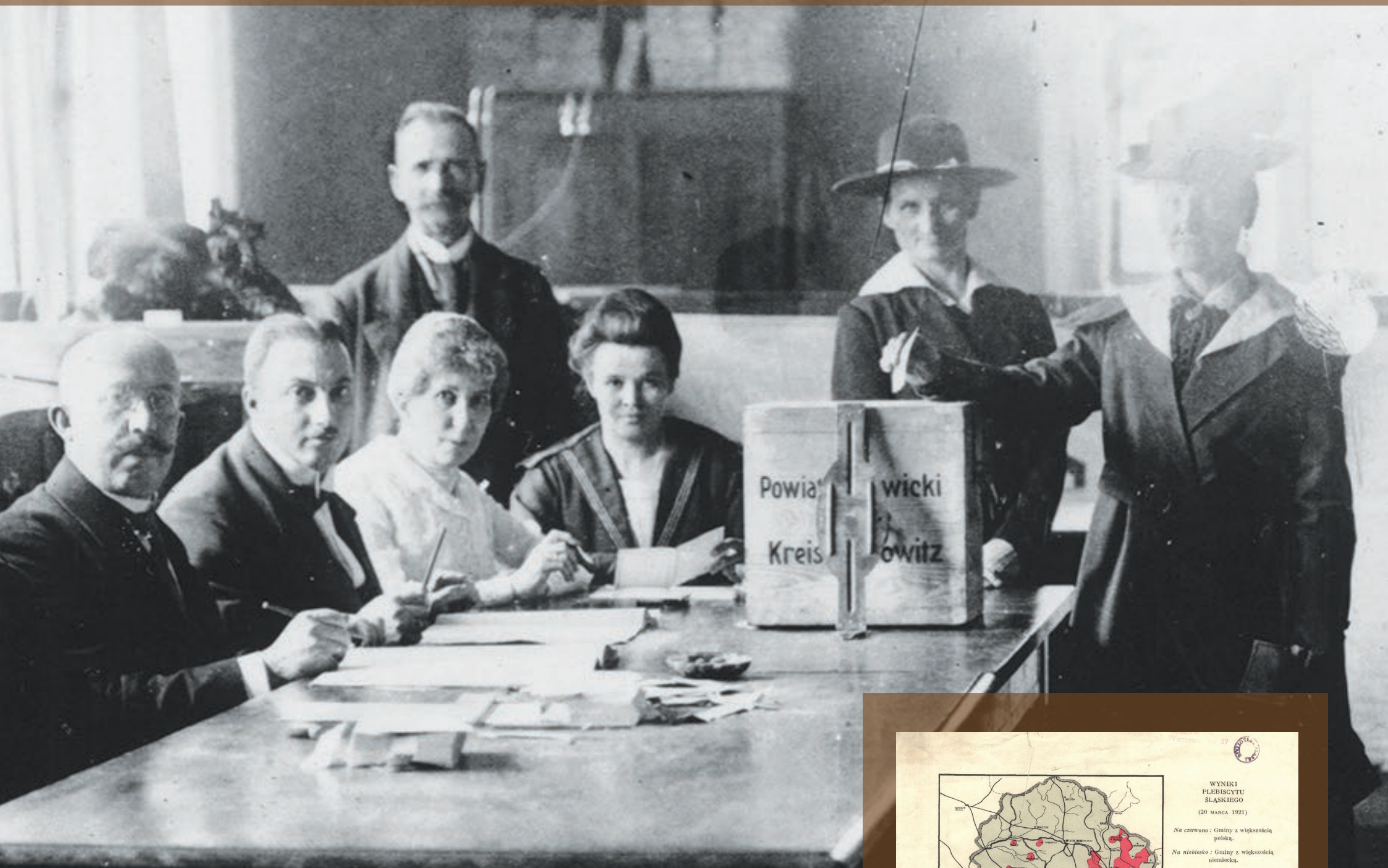
Lokal wyborczy w Katowicach, 20 marca 1921 r.

Plebiscyt odbył się w niedzielę 20 marca 1921 r. 59,6% głosujących opowiedziało się za przynależnością Górnego Śląska do Niemiec, zaś 40,3% do Polski. Niemcy wygrali głosami dużych miast, podczas gdy za Polską stanęli mieszkańcy obszarów wiejskich. Po plebiscycie obie strony w napięciu oczekiwały na decyzję MKRiP odnośnie podziału spornego terytorium. Wobec zagrożenia, że Polska otrzyma jedynie niewielką, południową część obszaru (za czym opowiadali się Włosi i Brytyjczycy), Korfanty zdecydował o wybuchu III powstania śląskiego.