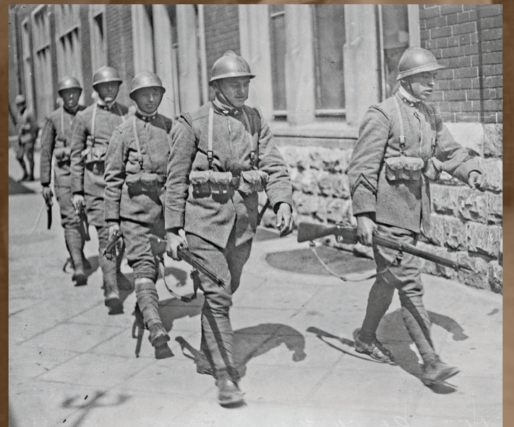
Szacuje się, że na Górnym Śląsku stacjonowało, w zależności od okresu, od ok. 10 tys. do 21 tys. żołnierzy Wojsk Sprzymierzonych. Na zdjęciu patrol włoski, 1920-1921

Traktat wersalski wszedł w życie 10 stycznia 1920 r. Wtedy też na Górnym Śląsku rozpoczęto realizację jego zapisów. Sporny obszar opuściło wojsko i władze niemieckie, a organizacje paramilitarne rozwiązano, dzięki czemu mieszkańcy uzyskać mieli swobodę w podjęciu decyzji o przynależności państwowej regionu. Władzę objęła Międzysojusznicza Komisja Rządząca i Plebiscytowa na Górnym Śląsku z siedzibą w Opolu. Komisji towarzyszyły podlegające jej wojska alianckie, pilnujące porządku oraz czuwające nad prawidłowym przebiegiem kampanii plebiscytowej i głosowania.