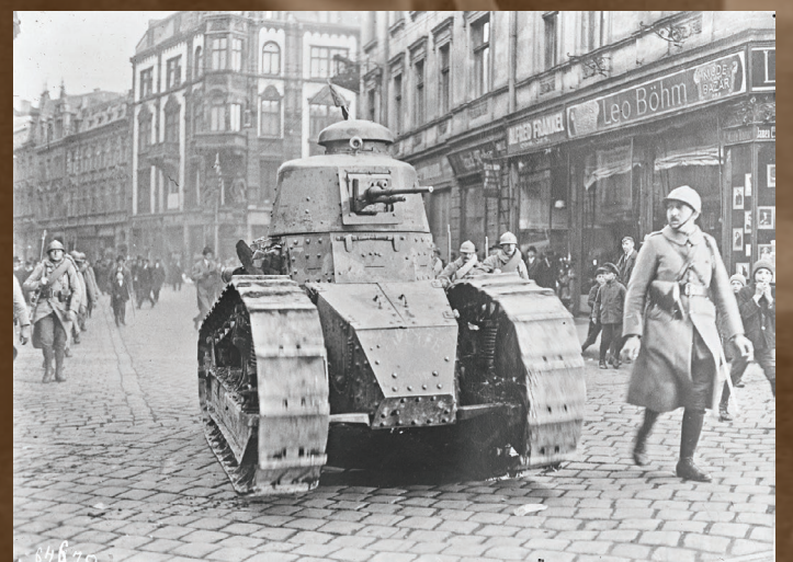
Tzw. „pokojowa okupacja” regionu przez aliantów trwała do lipca 1922 r. i oficjalnego objęcia przyznanych terytoriów przez Polskę i Niemcy. W jej trakcie wielokrotnie dało się zauważyć propolskie sympatie Francuzów oraz antypolskie nastawienie Włochów i Brytyjczyków. Na zdjęciu Francuzi na ulicach Katowic w dniu plebiscytu, 20 marca 1921 r.