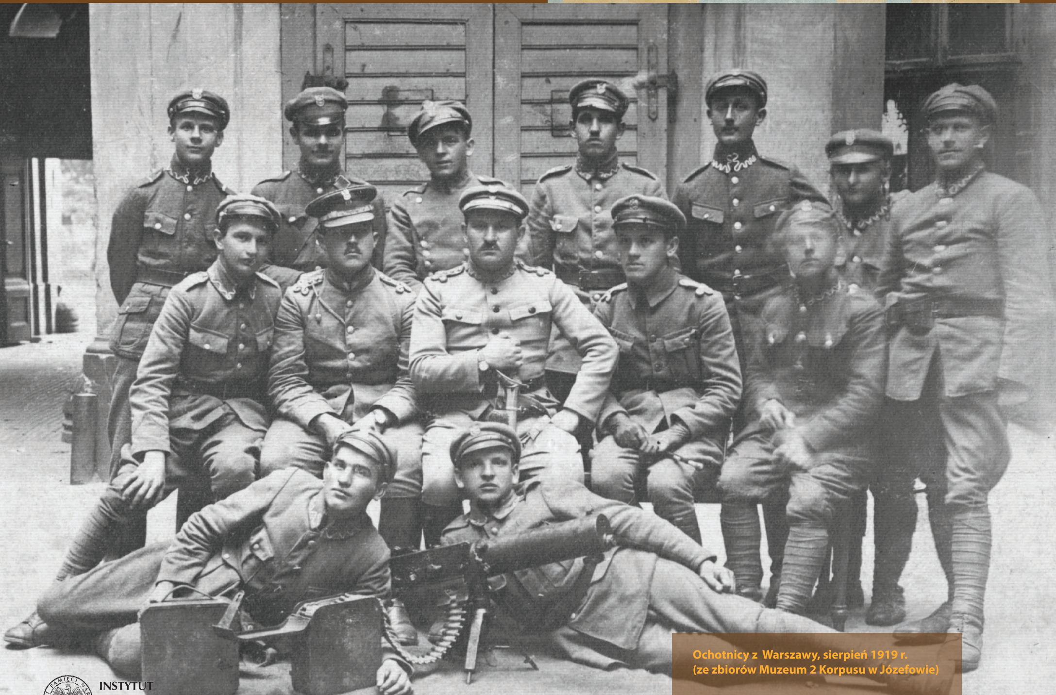
Ochotnicy z Warszawy, sierpień 1919 r.