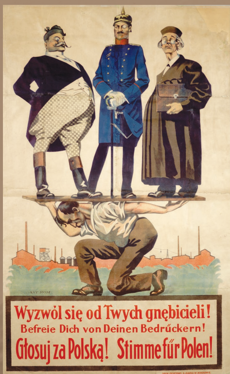
Obie strony masowo wydawały propagandowe odezwy, ulotki, plakaty, pocztówki, znaczki, afisze, wydawnictwa satyryczne, a także wiele tytułów wysokonakładowej prasy w obu językach. Ilustrowane przez najlepszych artystów, z dosadnymi hasłami, nawiązywały do głosowania za wybraną stroną. Na zdjęciu polski plakat propagandowy (ze zbiorów Biblioteki Śląskiej)