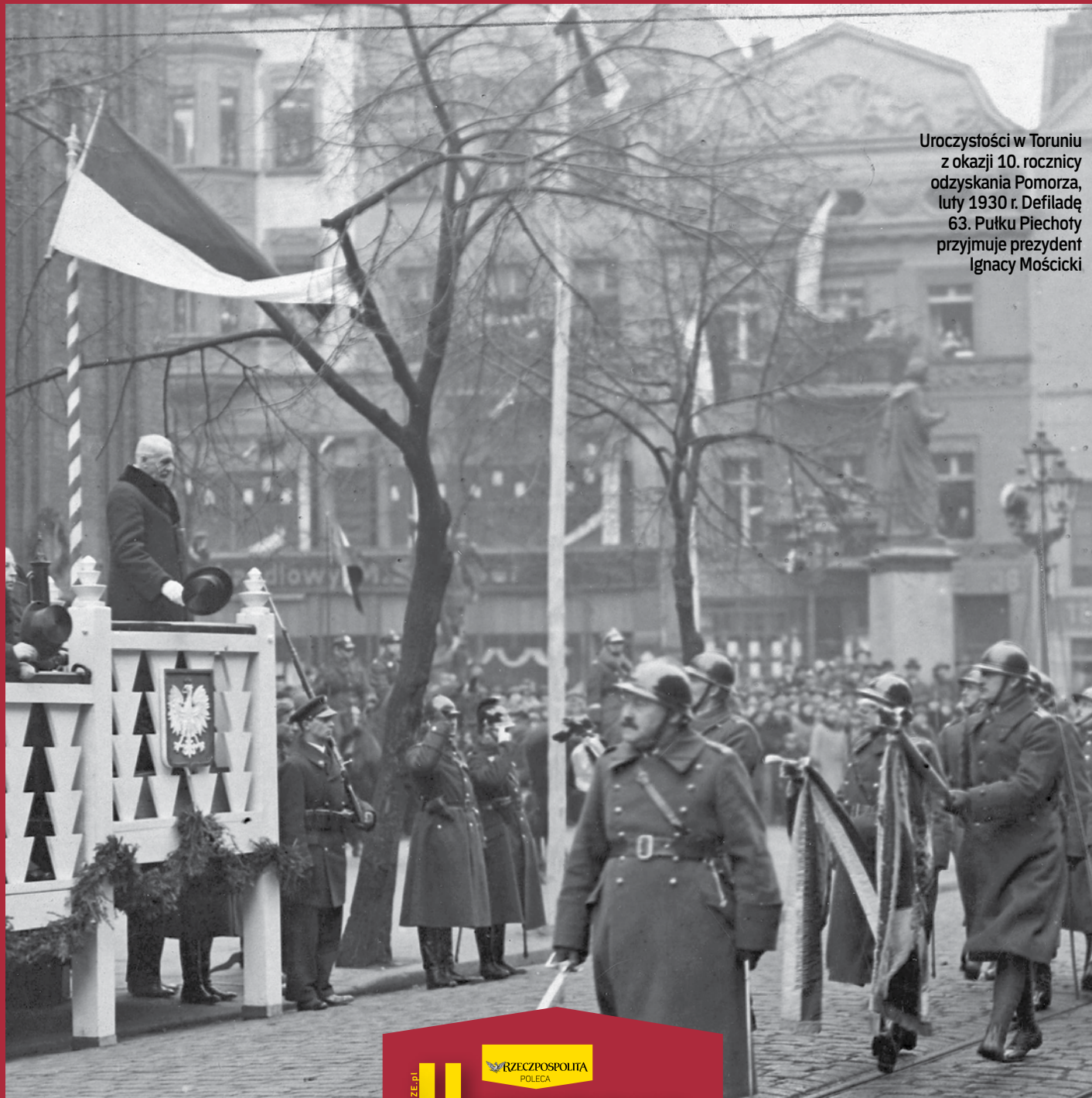
Uroczystości w Toruniu z okazji 10. rocznicy odzyskania Pomorza, luty 1930 r. Defiladę 63. Pułku Piechoty przyjmuje prezydent Ignacy Mościcki

HISTORIA UWAZAMRZE.pl RZECZPOSPOLITA POLECA HISTORIA WYDAWO