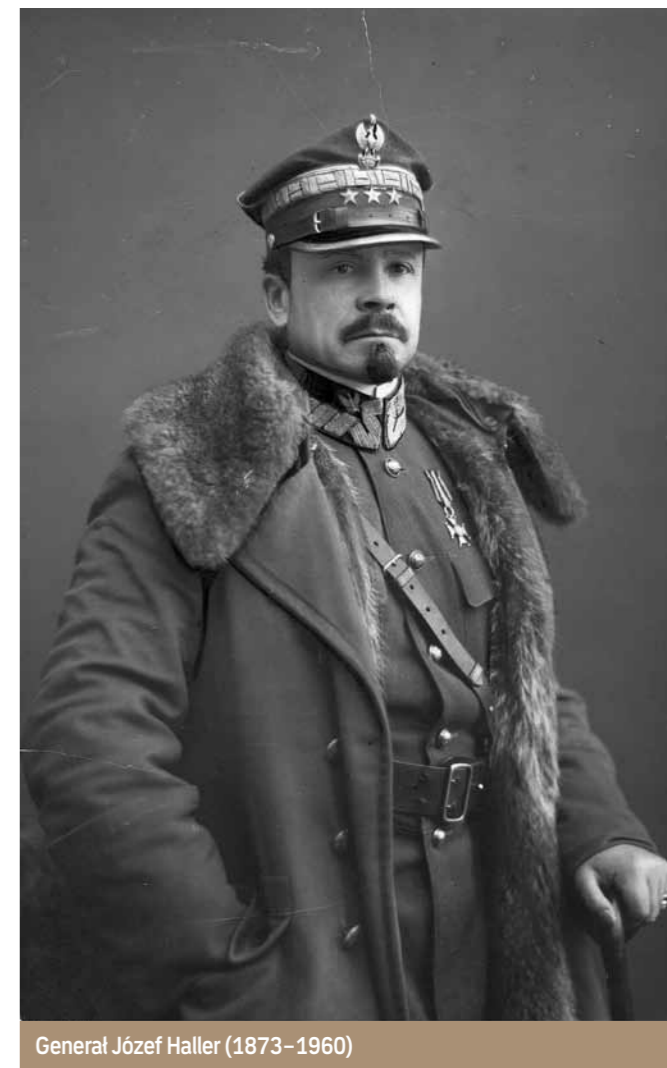
Generał Józef Haller (1873–1960)