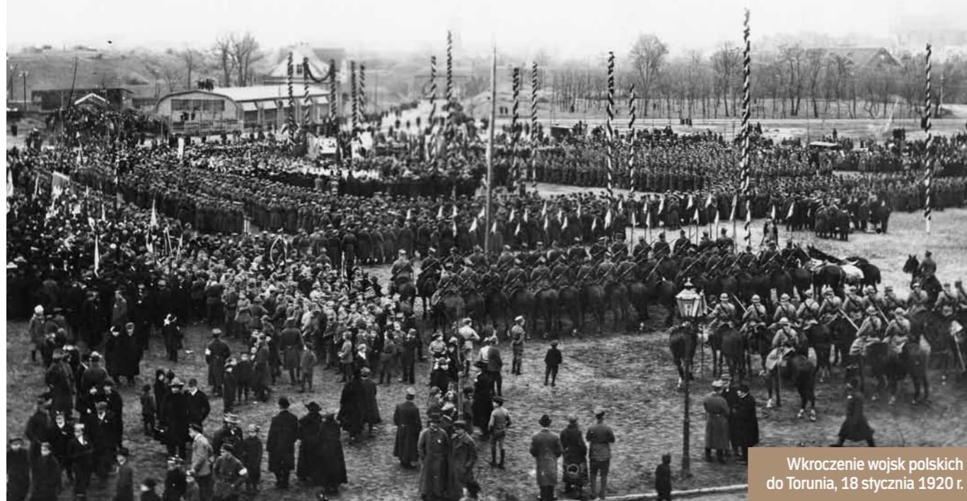
Wkroczenie wojsk polskich do Torunia, 18 stycznia 1920 r.