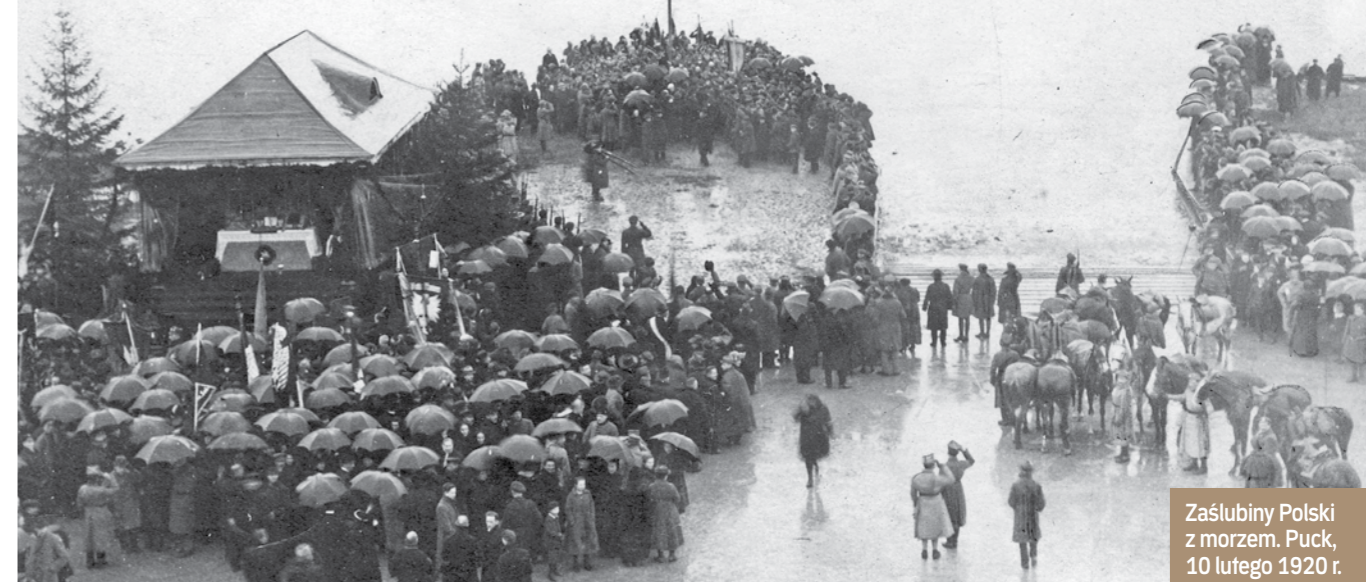
Zaślubiny Polski z morzem. Puck, 10 lutego 1920 r.