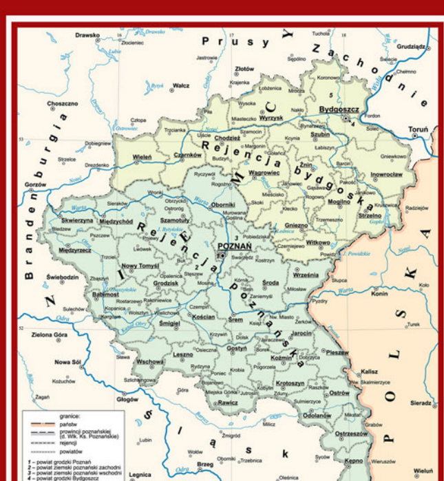
Mapa Prowincji Poznańskiej (autor Radosław Przebitkowski z: pw.ipn.gov.pl)