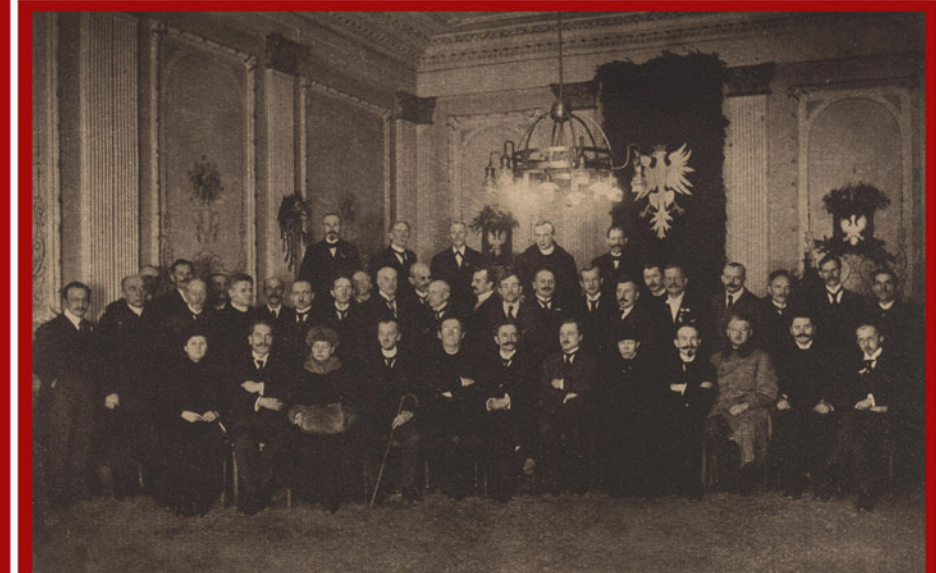
Naczelną Radę Ludową

Wyłonienie podczas Polskiego Sejmu Dzielnicowego [3-5 XII 1918 r.] własnej reprezentacji w postaci NACZELNEJ RADY LUDOWEJ i jej KOMISARIATU – głównego organu polskiej władzy na ziemiach polskiego zaboru pruskiego