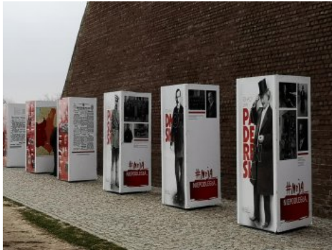
Jasnogórskie obchody 100-lecia odzyskania przez Polskę niepodległości.