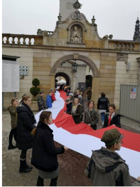
Jasnogórskie obchody 100-lecia odzyskania przez Polskę niepodległości.