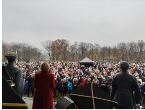
Jasnogórskie obchody 100-lecia odzyskania przez Polskę niepodległości.