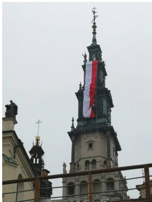
Jasnogórskie obchody 100-lecia odzyskania przez Polskę