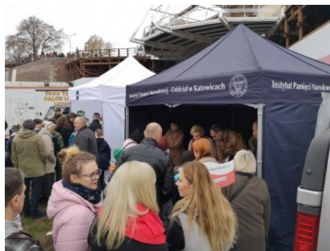
Jasnogórskie obchody 100-lecia odzyskania przez Polskę niepodległości.