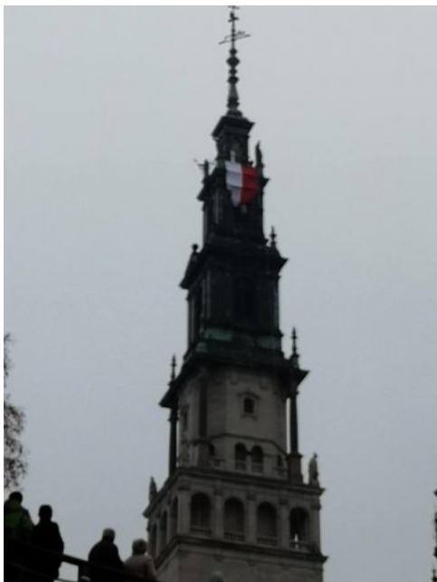
Jasnogórskie obchody 100-lecia odzyskania przez Polskę