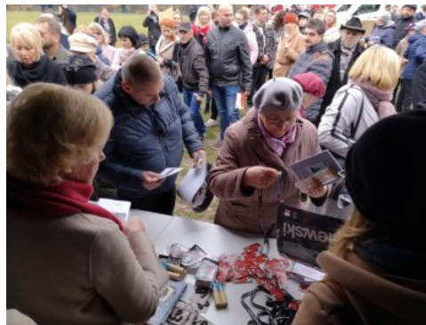
Jasnogórskie obchody 100-lecia odzyskania przez Polskę niepodległości.