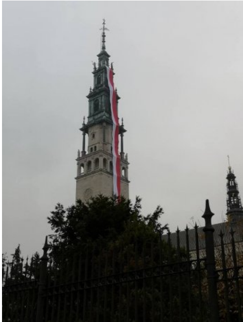
Jasnogórskie obchody 100-lecia odzyskania przez Polskę niepodległości.