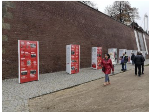
Jasnogórskie obchody 100-lecia odzyskania przez Polskę niepodległości.