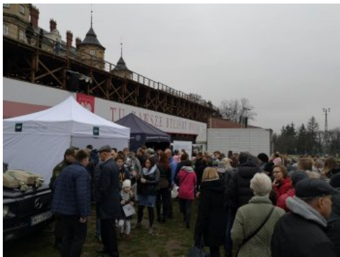
Jasnogórskie obchody 100-lecia odzyskania przez Polskę niepodległości.