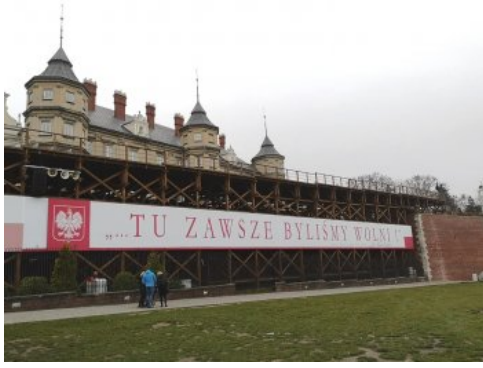
Jasnogórskie obchody 100-lecia odzyskania przez Polskę niepodległości.