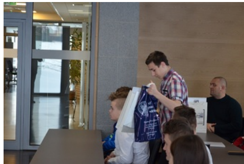
Wręczenie nagród laureatom konkursu „Ślady Niepodległości”.