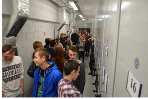
Zwiedzanie Archiwum Państwowego w Rzeszowie przez laureatów konkursu „Ślady Niepodległości”.