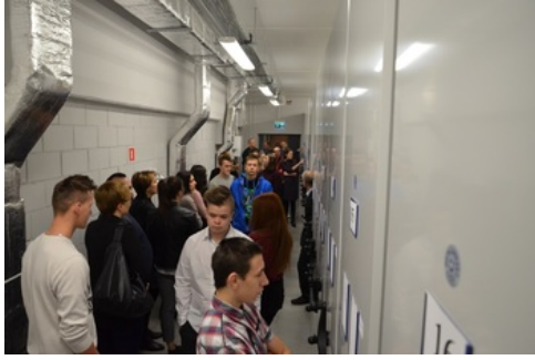
Zwiedzanie Archiwum Państwowego w Rzeszowie przez laureatów konkursu „Ślady Niepodległości”.