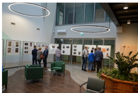
Prezentacja wystawy prac pokonkursowych „Ślady Niepodległości”.