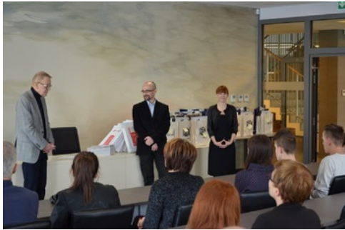
Wręczenie nagród laureatom konkursu „Ślady Niepodległości”.