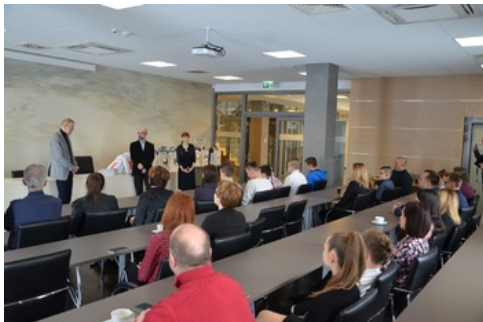
Wręczenie nagród laureatom konkursu „Ślady Niepodległości”.