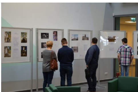
Prezentacja wystawy prac pokonkursowych „Ślady Niepodległości”.