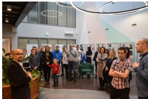
Wręczenie nagród laureatom konkursu „Ślady Niepodległości”.