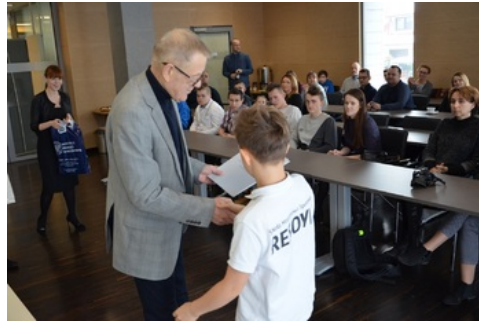
Wręczenie nagród laureatom konkursu „Ślady Niepodległości”.