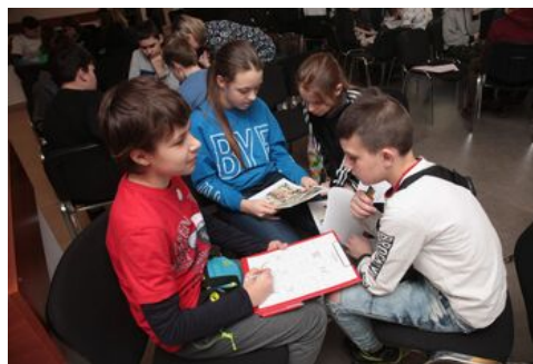
Prezentacja komiksu „Srebrni na szlakach Niepodległej” - warsztaty edukacyjne dla dzieci.