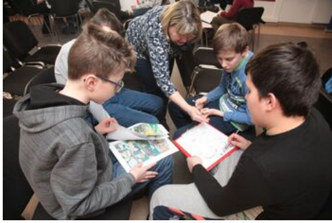
Prezentacja komiksu „Srebrni na szlakach Niepodległej” - warsztaty edukacyjne dla dzieci.