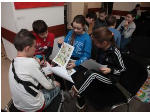
Prezentacja komiksu „Srebrni na szlakach Niepodległej” - warsztaty edukacyjne dla dzieci.