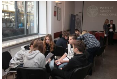
Prezentacja komiksu „Srebrni na szlakach Niepodległej” - warsztaty edukacyjne dla dzieci.