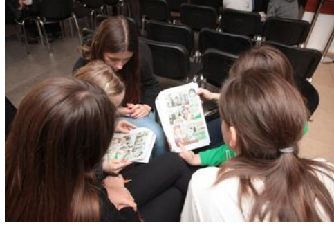
Prezentacja komiksu „Srebrni na szlakach Niepodległej” - warsztaty edukacyjne dla dzieci.