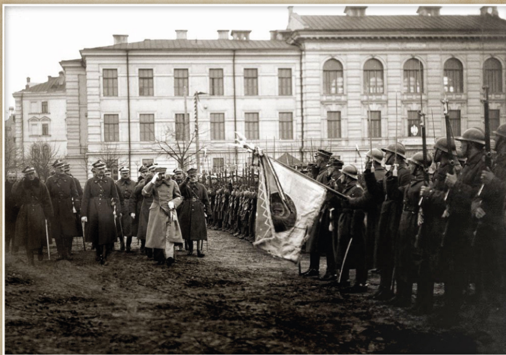
Wilno, Plac Łukiski, 19 kwietnia 1919 r. Przegląd oddziałów Wojska Polskiego po wrocie do miasta. Za Józefem Piłsudskim idą generalowie: Edward Śmigły-Rydz, Stanisław Szepczycki, Kazimierz Sosnkowski.