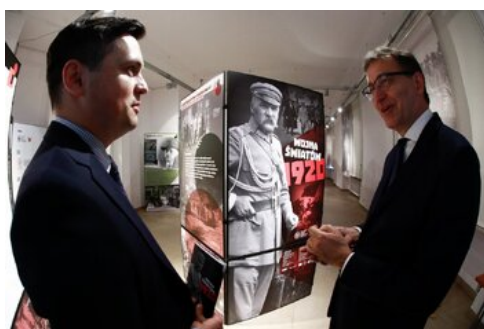
Otwarcie wystawy „Wojna światów 1920” - Warszawa, 12 sierpnia 2020.

Historyczne, Fortepan, East News, Getty Images, Instytut Polski i Muzeum im. gen. Sikorskiego w Londynie, Library of Congress, Muzeum Mazowieckie w Płocku, Muzeum Narodowe w Kielcach, Muzeum Narodowe w Warszawie, Muzeum Niepodległości w Warszawie, Muzeum Okręgowe w Suwałkach, Muzeum Wojska Polskiego w Warszawie, Muzeum Ziemi Kujawskiej i Dobrzyńskiej we Włocławku, Narodowe Archiwum Cyfrowe, Ośrodek KARTA, Polska Agencja Fotografów Forum, Roger Viollet, Ullstein Bild, Węgierskie Muzeum Narodowe w Budapeszcie.