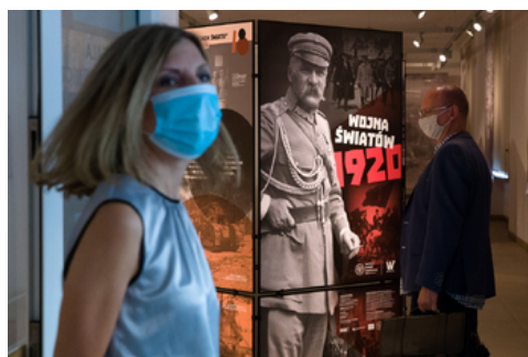
Otwarcie wystawy „Wojna światów 1920” - Warszawa, 12 sierpnia 2020.