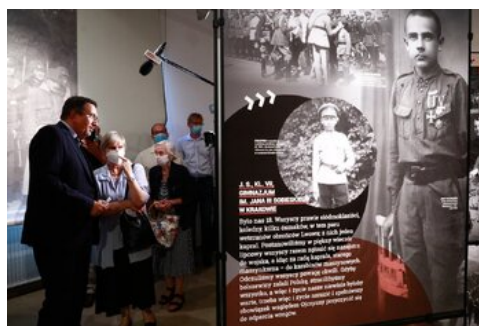
Otwarcie wystawy „Wojna światów 1920” - Warszawa, 12 sierpnia 2020.