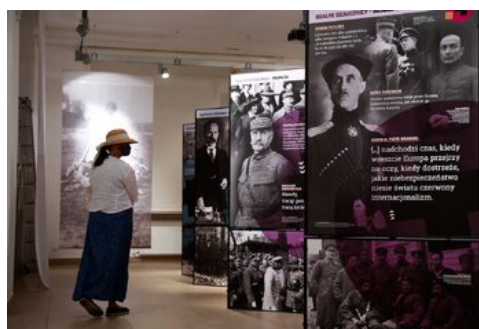
Otwarcie wystawy „Wojna światów 1920” - Warszawa, 12 sierpnia 2020.