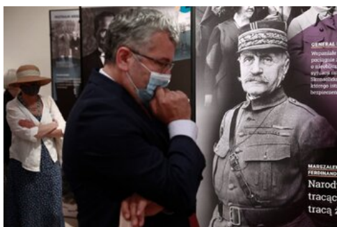
Otwarcie wystawy „Wojna światów 1920” - Warszawa, 12 sierpnia 2020.