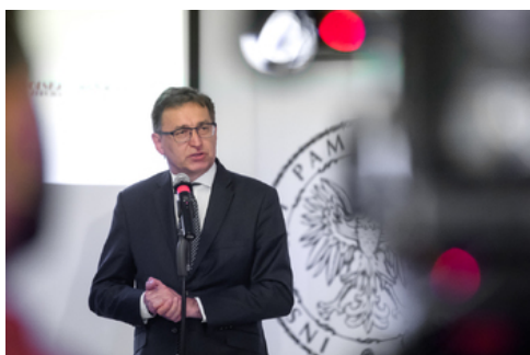
Prezes IPN Jarosław Szarek. Otwarcie wystawy „Wojna światów 1920” - Warszawa, 12 sierpnia 2020.