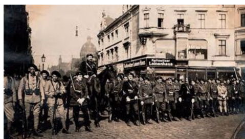
Francuzi na Rynku w Katowicach w 1920 r.