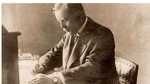
Wojciech Korfanty - polski komisarz plebiscytowy.