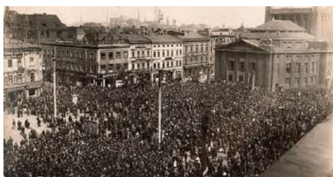
Manifestacja na rynku w Katowicach.

Cykl audycji „Z myślą o Niepodległej” w Polskim Radiu Katowice