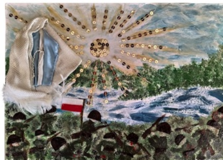
II.Nela Pawłowska SP Bogate