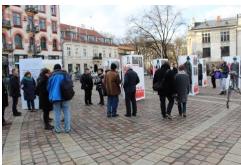
Otwarcie wystawy „Ojcowie Niepodległości” w Krakowie