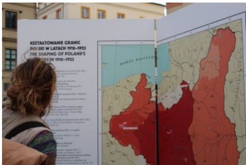
Otwarcie wystawy „Ojcowie Niepodległości” w Krakowie