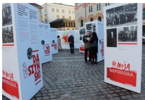
Otwarcie wystawy „Ojcowie Niepodległości” w Krakowie