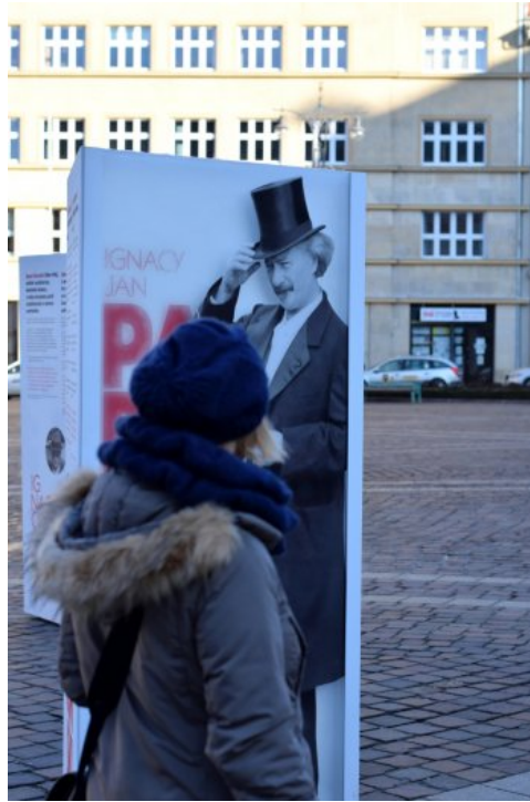
Otwarcie wystawy „Ojcowie Niepodległości” w Krakowie