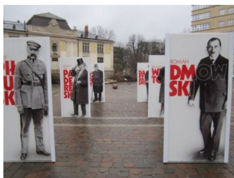
Otwarcie wystawy „Ojciec Niepodległości” w Krakowie