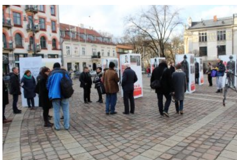
Otwarcie wystawy „Ojcowie Niepodległości” w Krakowie