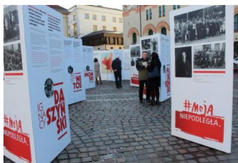
Otwarcie wystawy „Ojcowie Niepodległości” w Krakowie