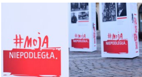
Otwarcie wystawy „Ojcowie