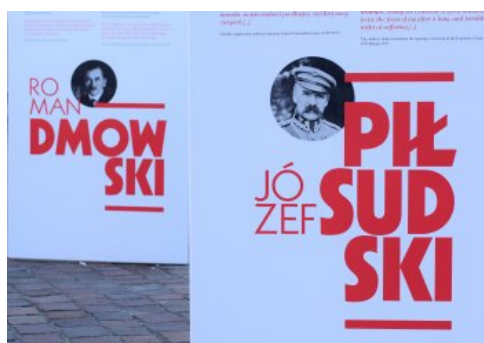
Otwarcie wystawy „Ojciec Niepodległości” w Krakowie

Bardziej szczegółowy program przedsięwzięć związanych ze stuleciem odzyskania niepodległości oraz ofertę edukacyjną Oddziału IPN w Krakowie można znaleźć w internecie.