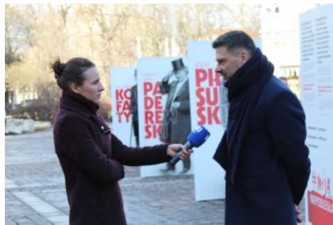
Otwarcie wystawy „Ojcowie Niepodległości” w Krakowie