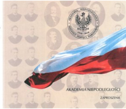
Zaproszenie na wykłady Akademii Niepodległości