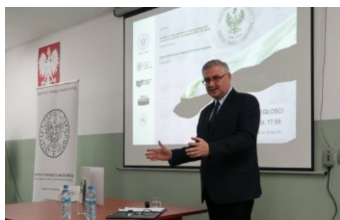
Dr Waldemar Brenda

Przypomnijmy, że Akademia Niepodległości to ogólnopolski, czteroletni projekt Instytutu Pamięi Narodowej to cykl comiesięcznych spotkań, które przedstawiają drogę do niepodległości, budowę nowej państwowości i syntetyczny bilans dwudziestolecia. Wykłady poszerzone o wątek lokalnych wydarzeń przekażą wiedzę historyczną i zaprezentują godne naśladowania postawy patriotyczne. Patronat honorowy nad Akademią Niepodległości sprawuje Prezydent Rzeczypospolitej Polskiej Andrzej Duda.