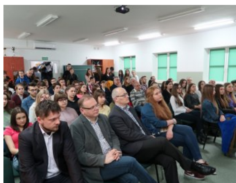
Słuchacze Akademii Niepodległości w Grajewie