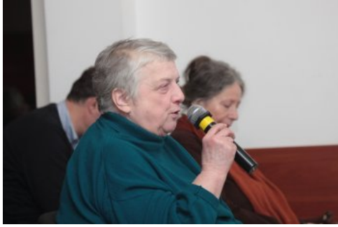
Dyskusja o mniejszościach narodowych II RP - Warszawa, 22 marca 2018.