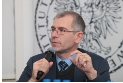
Prof. Grzegorz Motyka. Dyskusja o mniejszościach narodowych II RP - Warszawa, 22 marca 2018.