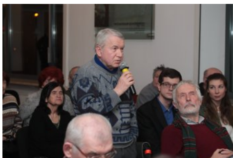
Dyskusja o mniejszościach narodowych II RP – Warszawa, 22 marca 2018.