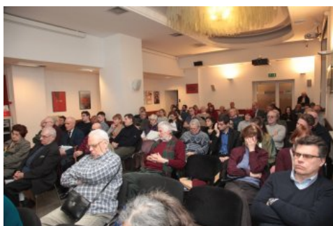
Dyskusja o mniejszościach narodowych II RP – Warszawa, 22 marca 2018.