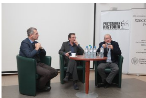
Dyskusja o mniejszościach narodowych II RP – Warszawa, 22 marca 2018.