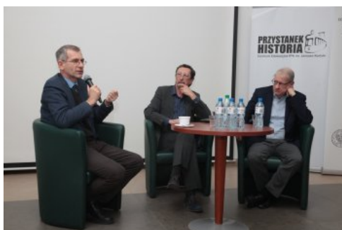
Dyskusja o mniejszościach narodowych II RP – Warszawa, 22 marca 2018.