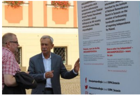
Otwarcie wystawy „Ojcowie Niepodległości”