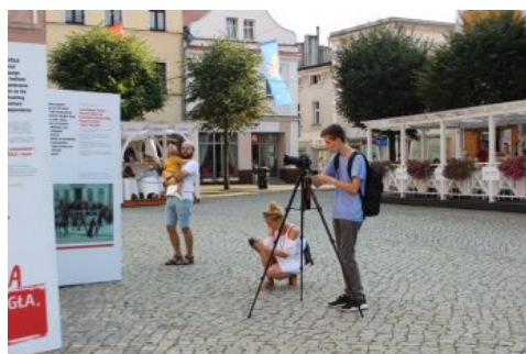
Otwarcie wystawy „Ojcowie Niepodległości”