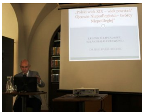
Otwarcie wystawy „Ojcowie Niepodległości”