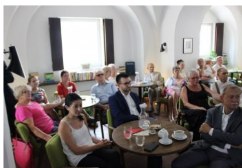
Otwarcie wystawy „Ojcowie Niepodległości”