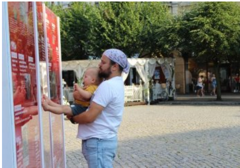
Otwarcie wystawy „Ojcowie Niepodległości”