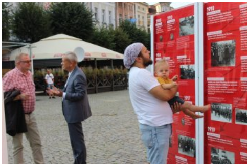
Otwarcie wystawy „Ojcowie Niepodległości”