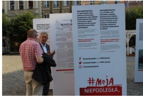
Otwarcie wystawy „Ojcowie Niepodległości”