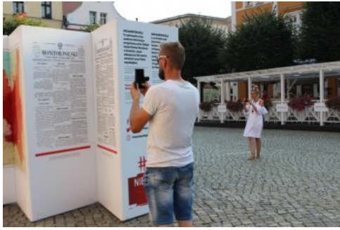
Otwarcie wystawy „Ojcowie Niepodległości”