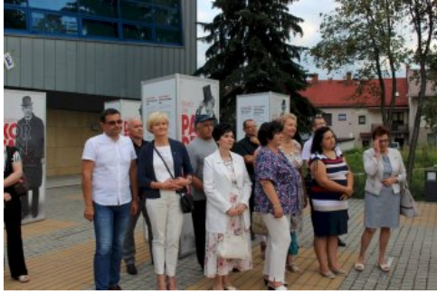
W Chrzanowie można oglądać plenerową wystawę „Ojcowie Niepodległości”