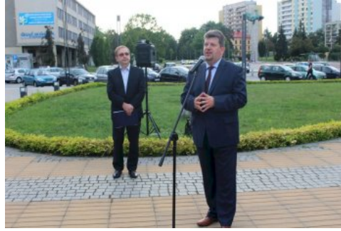
W Chrzanowie można oglądać plenerową wystawę „Ojcowie Niepodległości”