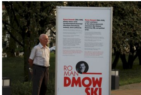
W Chrzanowie można oglądać plenerową wystawę „Ojcowie Niepodległości”