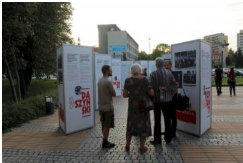
W Chrzanowie można oglądać plenerową wystawę „Ojcowie Niepodległości”