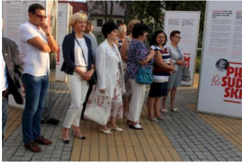
W Chrzanowie można oglądać plenerową wystawę „Ojcowie Niepodległości”