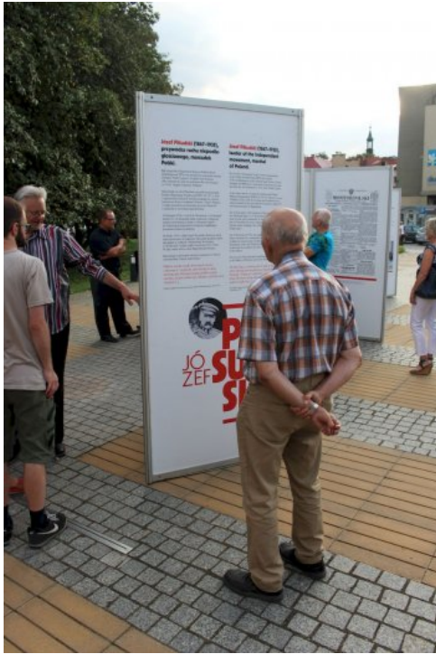
W Chrzanowie można oglądać plenerową wystawę „Ojcowie Niepodległości”