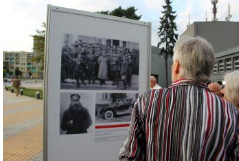
W Chrzanowie można oglądać plenerową wystawę „Ojcowie Niepodległości”