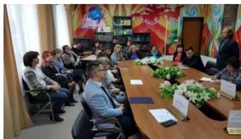
Uczestnicy spotkania z delegacją IPN, w tym przedstawiciele społeczności polskiej w Astanie