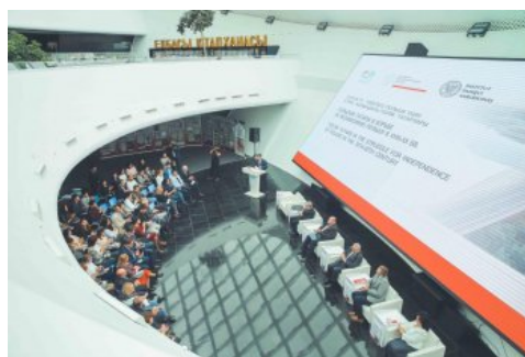
Sesja naukowa w bibliotece prezydenckiej