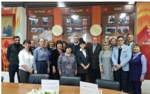
Uczestnicy spotkania z delegacją IPN