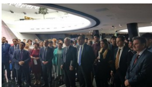
Spotkanie uczestników otwarcia wystawy z przedstawicielami IPN