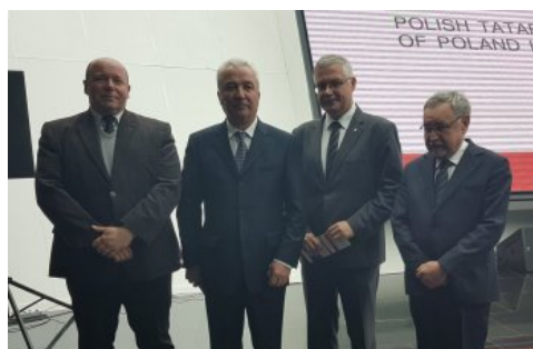
Ambasador Ukrainy (drugi od lewej) wśród organizatorów sesji i otwarcia wystawy w Astanie