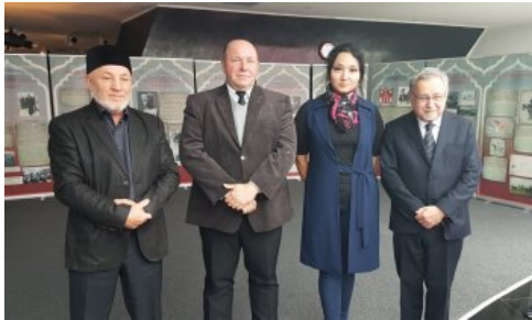
Organizatorzy sesji na tle wystawy o Tatarach