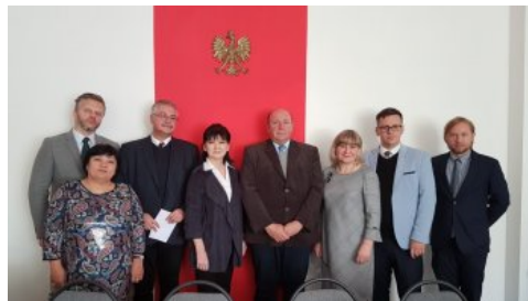
Uczestnicy spotkania w Pracowni Języka Polskiego na Uniwersytecie im. Gumilowa w Astanie