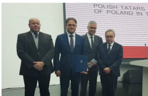
Wiceminister spraw zagranicznych Kazachstanu (drugi od lewej) po przekazaniu listu Prezesa IPN