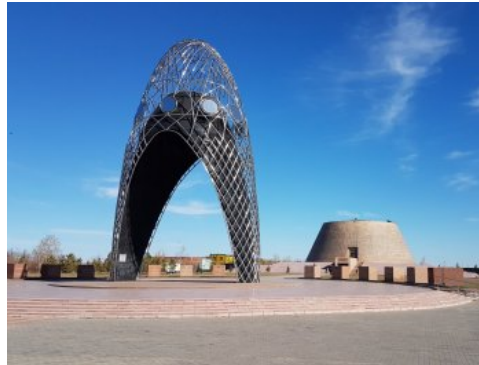
Łuk Cierpienia i muzeum upamiętniające zbrodnie sowieckie w Ałżirze