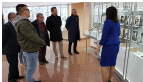
Delegacja IPN w muzeum sowieckiego ludobójstwa w Ałżirze