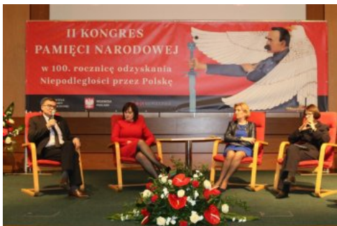
Uczestnicy dyskusji panelowej „Polskie drogi do Niepodległości”