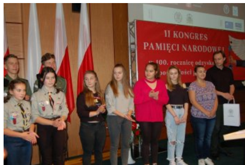
Nagrodzeni przez IPN uczestnicy gry miejskiej „Ślady Niepodległej w Białymstoku”