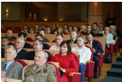
Uczestnicy II Kongresu Pamięci Narodowej