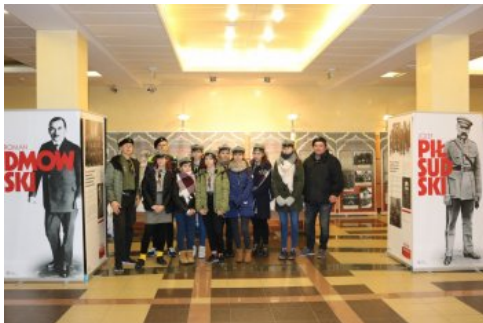
Uczestnicy gry miejskiej