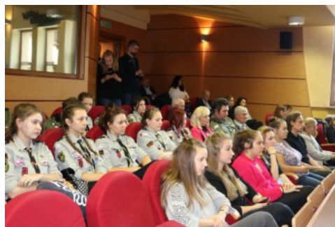
Uczestnicy II Kongresu Pamięci Narodowej