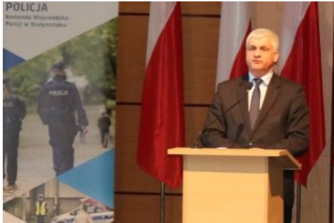
Przemówienie wojewody podlaskiego Bohdana Paszkowskiego