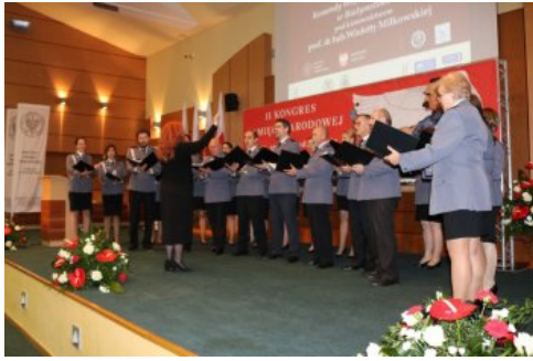
Występ Chóru Komendy Wojewódzkiej Policji w Białymstoku