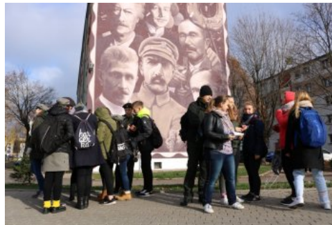
Uczestnicy gry miejskiej