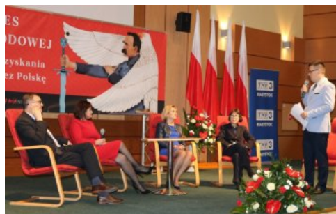
Uczestnicy dyskusji panelowej „Polskie drogi do Niepodległości”