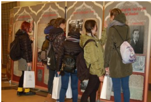
Młodzież z zainteresowaniem ogląda towarzyszącą Kongresowi wystawę „Dla Niepodległej. Tatarzy w walce o wolną Polskę w XVIII-XX wieku”