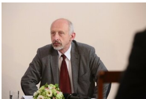
Czwarta debata belwederska historyków - Warszawa, 19 czerwca 2017.