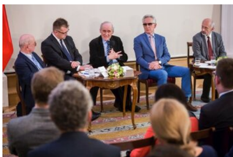
Czwarta debata belwederska historyków - Warszawa, 19 czerwca 2017.