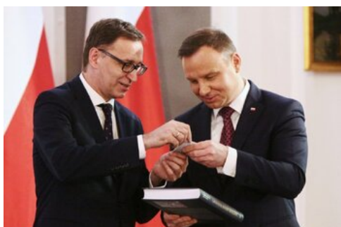
Czwarta debata belwederska historyków - Warszawa, 19 czerwca 2017.