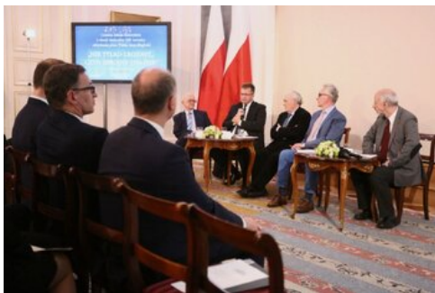
Czwarta debata belwederska historyków - Warszawa, 19 czerwca 2017.