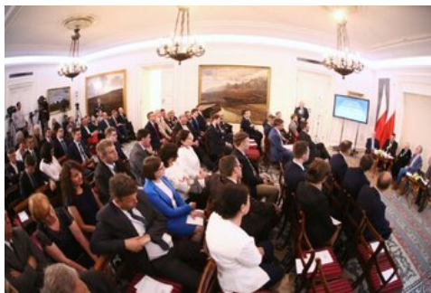
Czwarta debata belwederska historyków - Warszawa, 19 czerwca 2017.