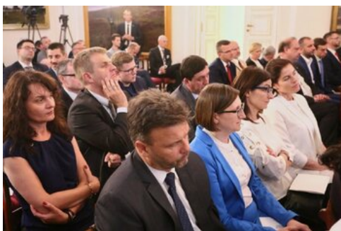
Czwarta debata belwederska historyków - Warszawa, 19 czerwca 2017.