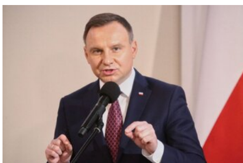
Czwarta debata belwederska historyków - Warszawa, 19 czerwca 2017.