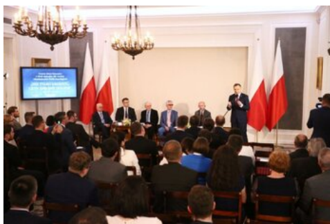
Czwarta debata belwederska historyków - Warszawa, 19 czerwca 2017.