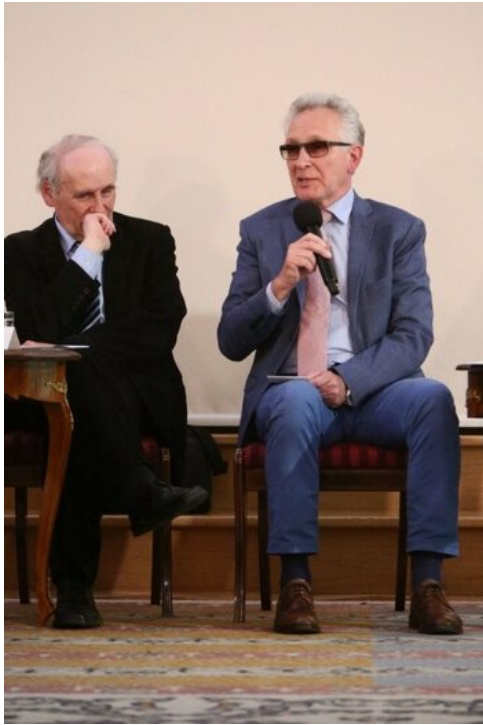
Czwarta debata belwederska historyków - Warszawa, 19 czerwca 2017.