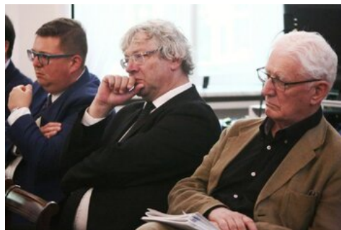
Czwarta debata belwederska historyków - Warszawa, 19 czerwca 2017.