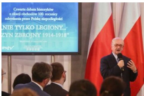
Czwarta debata belwederska historyków - Warszawa, 19 czerwca 2017.