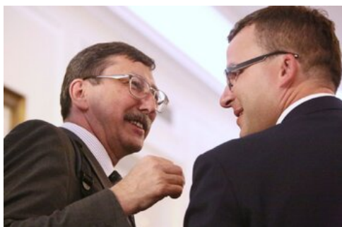
Czwarta debata belwederska historyków - Warszawa, 19 czerwca 2017.