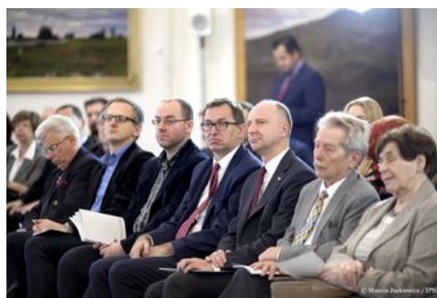
Piąta debata belwederska historyków - Warszawa, 20 października 2017.