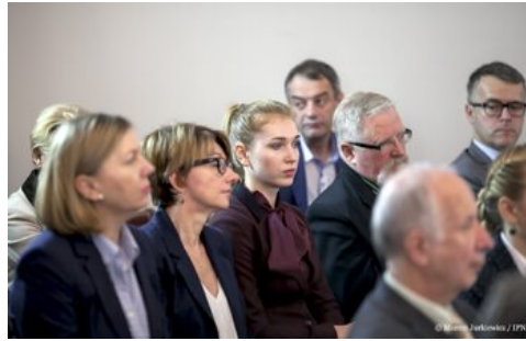
Piąta debata belwederska historyków - Warszawa, 20 października 2017.