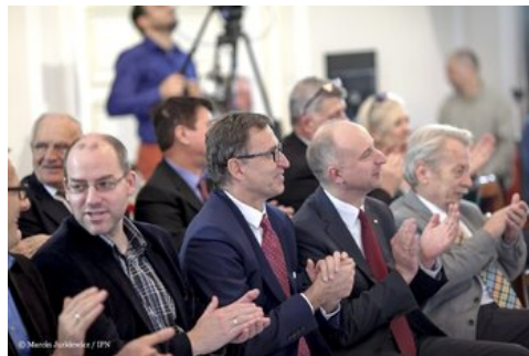
Piąta debata belwederska historyków - Warszawa, 20 października 2017.