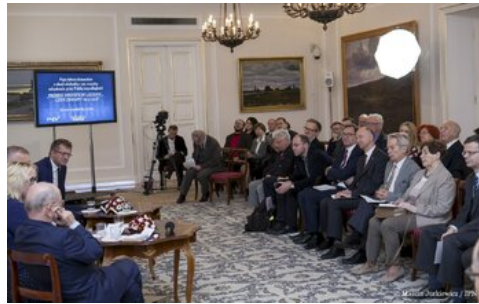
Piąta debata belwederska historyków - Warszawa, 20 października 2017.