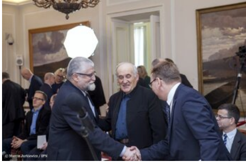
Piąta debata belwederska historyków - Warszawa, 20 października 2017.