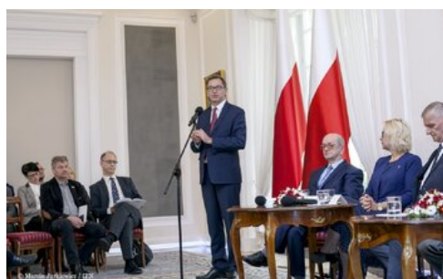
Piąta debata belwederska historyków - Warszawa, 20 października 2017.