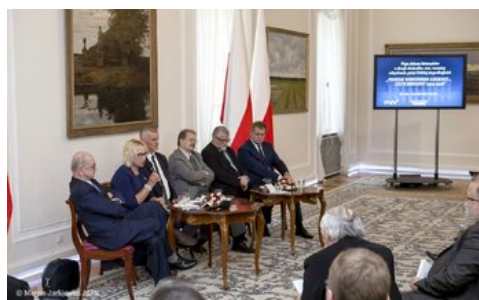
Piąta debata belwederska historyków - Warszawa, 20 października 2017.