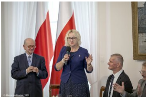
Piąta debata belwederska historyków - Warszawa, 20 października 2017.