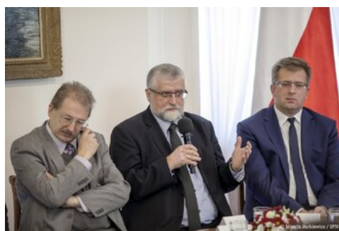
Piąta debata belwederska historyków - Warszawa, 20 października 2017.