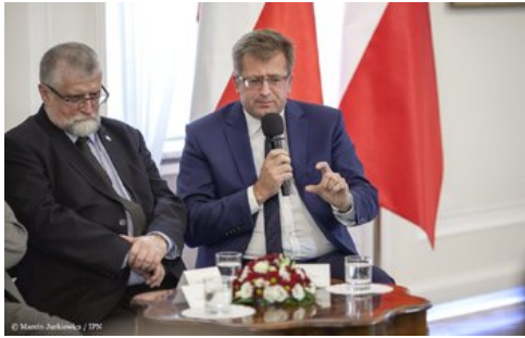
Piąta debata belwederska historyków - Warszawa, 20 października 2017.