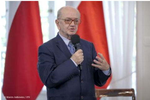
Piąta debata belwederska historyków - Warszawa, 20 października 2017.