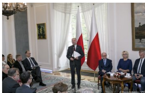
Piąta debata belwederska historyków - Warszawa, 20 października 2017.

kolejnych spotkań w Belwederze historycy rozmawiali m.in. o roli prezydenta USA dla polskiej niepodległości, skutkach rewolucji lutowej i rewolucji październikowej w Rosji oraz powstaniu Armii Polskiej we Francji pod dowództwem gen. Józefa Hallera.