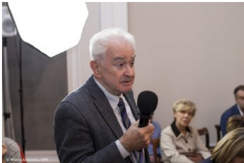
Piąta debata belwederska historyków - Warszawa, 20 października 2017.