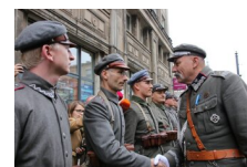
Marszałek Piłsudski otwiera „Przystanek Niepodległość” - 5 listopada 2018.