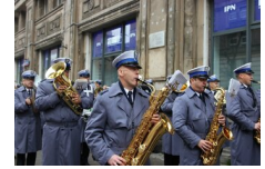
Marszałek Piłsudski otwiera „Przystanek Niepodległość” - 5 listopada 2018.