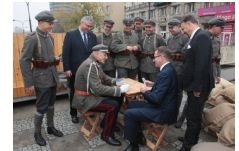
Marszałek Piłsudski otwiera „Przystanek Niepodległość” - 5 listopada 2018.