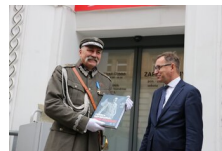
Marszałek Piłsudski otwiera „Przystanek Niepodległość” - 5 listopada 2018.