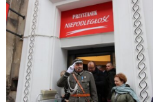
Marszałek Piłsudski otwiera „Przystanek Niepodległość” - 5 listopada 2018.