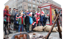
Marszałek Piłsudski otwiera „Przystanek Niepodległość” - 5 listopada 2018.