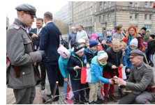
Marszałek Piłsudski otwiera „Przystanek Niepodległość” - 5 listopada 2018.