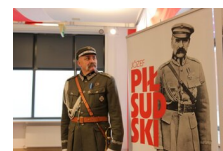
Marszałek Piłsudski otwiera „Przystanek Niepodległość” - 5 listopada 2018.