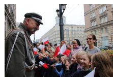
Marszałek Piłsudski otwiera „Przystanek Niepodległość” - 5 listopada 2018.