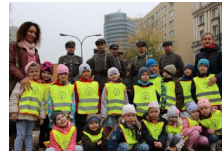
Marszałek Piłsudski otwiera „Przystanek Niepodległość” - 5 listopada 2018.