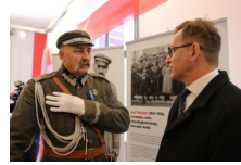
Marszałek Piłsudski otwiera „Przystanek Niepodległość” - 5 listopada 2018.