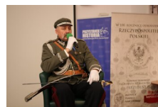
Marszałek Piłsudski otwiera