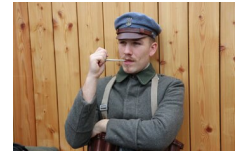
Marszałek Piłsudski otwiera „Przystanek Niepodległość” - 5 listopada 2018.