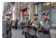
Marszałek Piłsudski otwiera „Przystanek Niepodległość” - 5 listopada 2018.

Razem świętujemy 100. rocznicę niepodległości