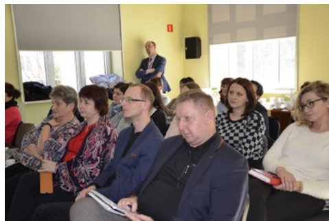
Spotkanie dla nauczycieli w ramach szkoleń „Zmagania o niepodległość Polski do listopada 1918 r. oraz budowa struktur państwa i wojny o granice Rzeczypospolitej”.