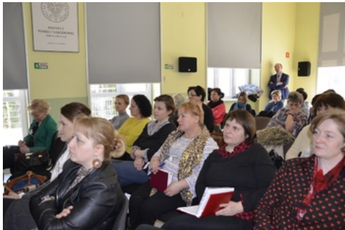
Spotkanie dla nauczycieli w ramach szkoleń „Zmagania o niepodległość Polski do listopada 1918 r. oraz budowa struktur państwa i wojny o granice Rzeczypospolitej”.