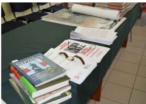
Warsztaty dla nauczycieli w ramach szkoleń „Zmagania o niepodległość Polski do listopada 1918 r. oraz budowa struktur państwa i wojny o granice