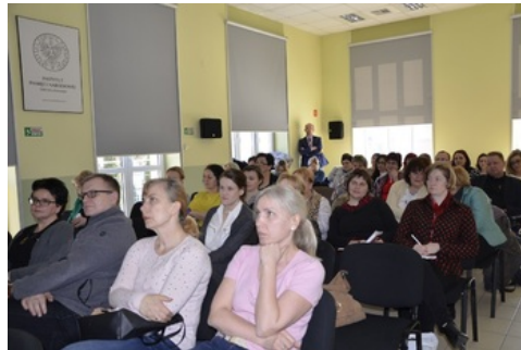
Spotkanie dla nauczycieli w ramach szkoleń „Zmagania o niepodległość Polski do listopada 1918 r. oraz budowa struktur państwa i wojny o granice Rzeczypospolitej”.