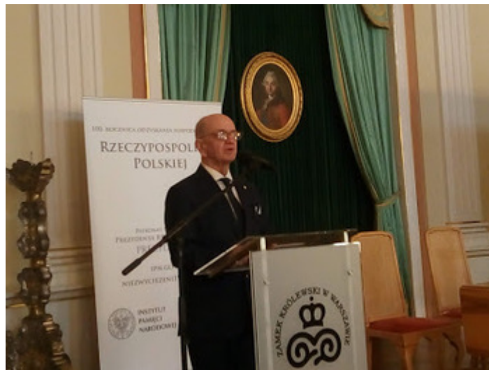
Konferencja naukowa „Bilans rozbiorów. Refleksje i pytania na stulecie odzyskania niepodległości”