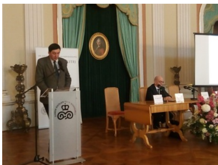
Konferencja naukowa „Bilans rozbiorów. Refleksje i pytania na stulecie odzyskania niepodległości”