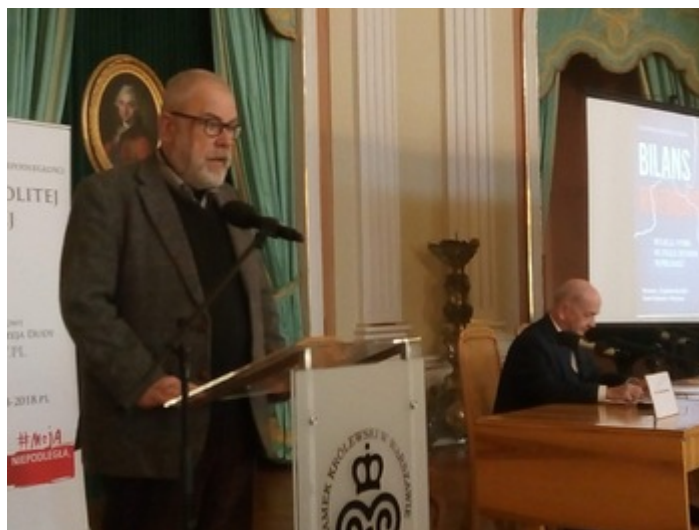
Konferencja naukowa „Bilans rozbiorów. Refleksje i pytania na stulecie odzyskania niepodległości”