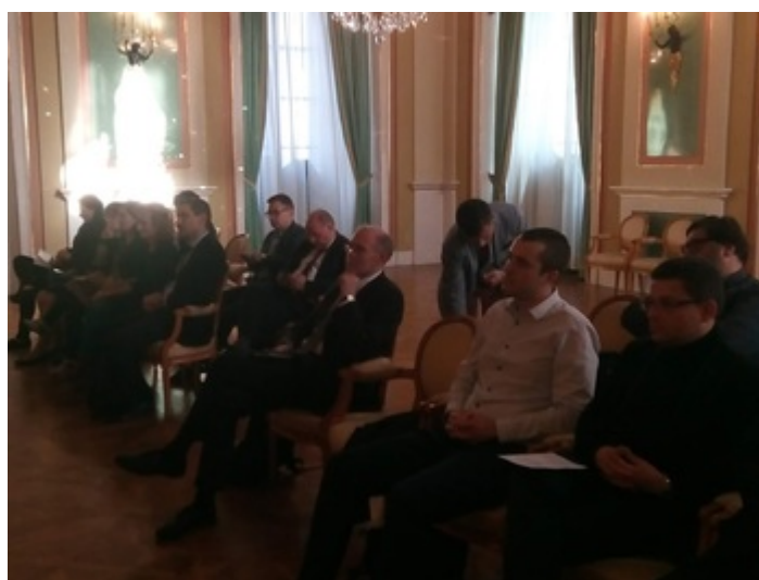
Konferencja naukowa „Bilans rozbiorów. Refleksje i pytania na stulecie odzyskania niepodległości”