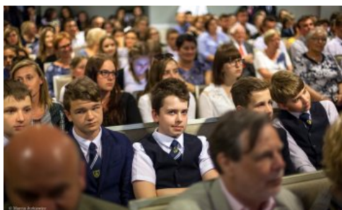
Uroczysta gala konkursu „O Naszą Niepodległą!” - Warszawa, 3 czerwca 2018.