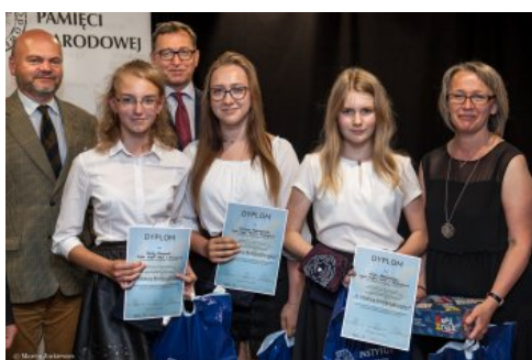
Uroczysta gala konkursu „O Naszą Niepodległą!” - Warszawa, 3 czerwca 2018.