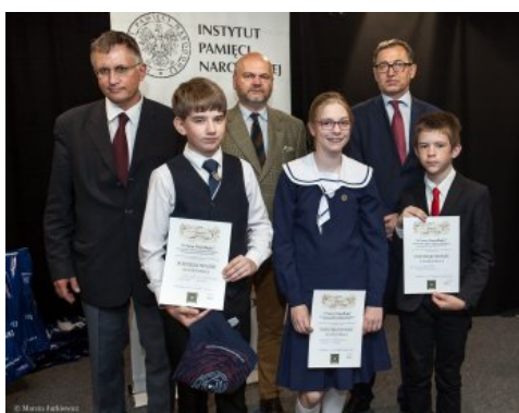
Uroczysta gala konkursu „O Naszą Niepodległą!” - Warszawa, 3 czerwca 2018.