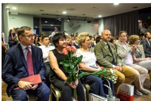
Uroczysta gala konkursu „O Naszą Niepodległa!" - Warszawa, 3 czerwca 2018.