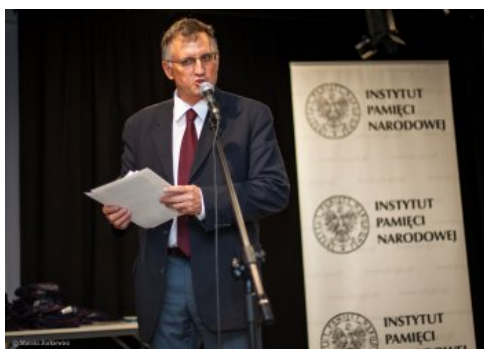
Uroczysta gala konkursu „O Naszą Niepodległą!” - Warszawa, 3 czerwca 2018.