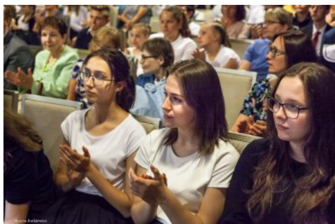
Uroczysta gala konkursu „O Naszą Niepodległą!” - Warszawa, 3 czerwca 2018.