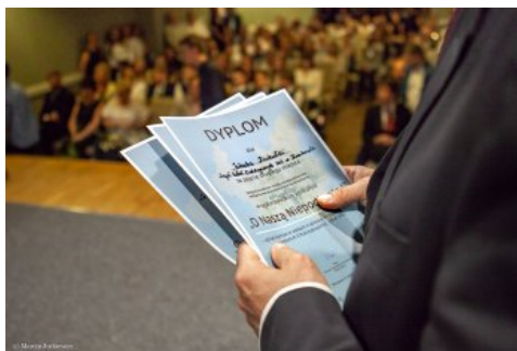
Uroczysta gala konkursu „O Naszą Niepodległą!” - Warszawa, 3 czerwca 2018.