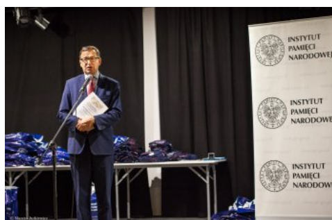
Uroczysta gala konkursu „O Naszą Niepodległą!” – Warszawa, 8