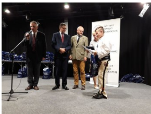
Uroczysta gala konkursu „O Naszą Niepodległa!" - Warszawa, 3 czerwca 2018