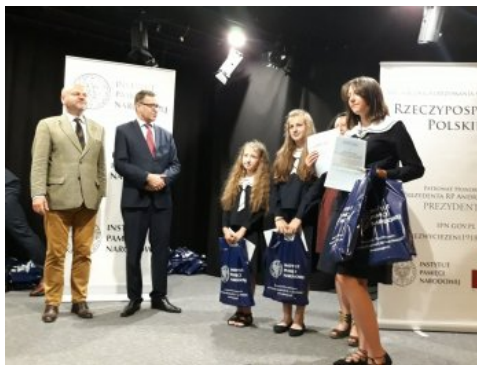
Uroczysta gala konkursu „O Naszą Niepodległa!" - Warszawa, 3 czerwca 2018

Niepodległa!" - Warszawa, 3 czerwca 2018.