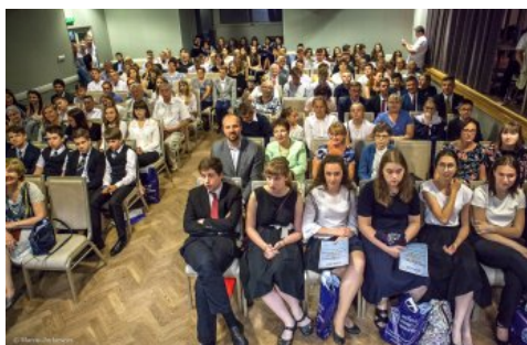
Uroczysta gala konkursu „O Naszą Niepodległa!" - Warszawa, 3 czerwca 2018.