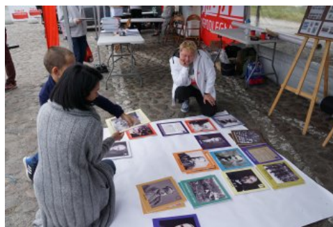
Bialo-czerwony szlak #mojaniepodległa w Dębnie