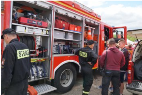
Bialo-czerwony szlak #mojaniepodległa w Świdwinie, fot. M. Ruczyńska