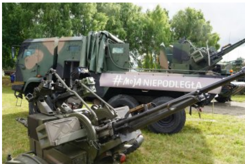
Bialo-czerwony szlak #mojaniepodległa w Barlinku