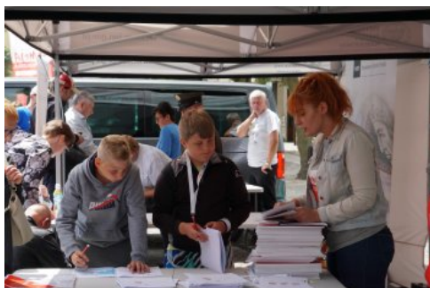
Bialo-czerwony szlak #mojaniepodległa w Dębnie