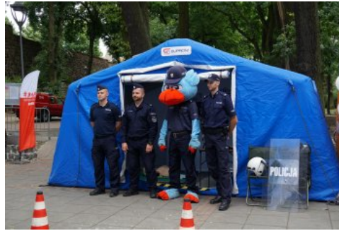
Bialo-czerwony szlak #mojaniepodległa w Stargardzie