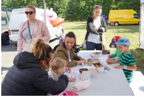
Bialo-czerwony szlak #mojaniepodległa w Świdwinie