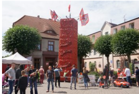
Bialo-czerwony szlak #mojaniepodległa w Polczynie- Zdroju