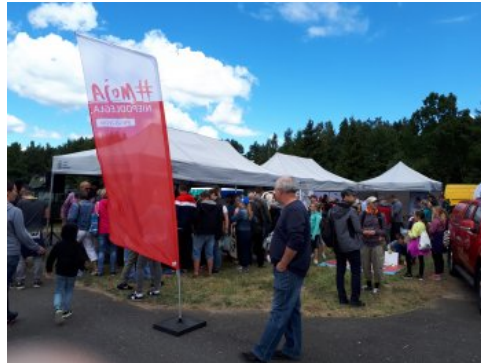
Bialo-czerwony szlak #mojaniepodległa w Świdwinie