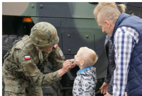
Bialo-czerwony szlak #mojaniepodległa w Dębnie