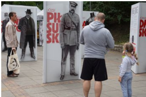
Bialo-czerwony szlak #mojaniepodległa w Stargardzie