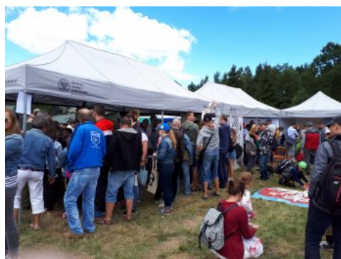
Bialo-czerwony szlak #mojaniepodległa w Świdwinie