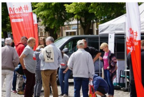
Bialo-czerwony szlak #mojaniepodległa w Dębnie, fot. M. Ruczyńska

Regionalny w Szczecinie, Narodowy Bank Polski Oddział Okręgowy w Szczecinie, Komenda Wojewódzka Państwowej Straży Pożarnej w Szczecinie, Komenda Wojewódzka Policji w Szczecinie, Okręgowy Inspektorat Służby Więziennej w Szczecinie, Regionalna Dyrekcja Lasów Państwowych w Szczecinie.