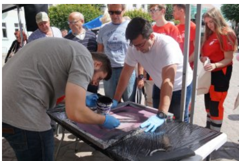
Bialo-czerwony szlak #mojaniepodległa w Polczynie- Zdroju, fot. M. Ruczyńska