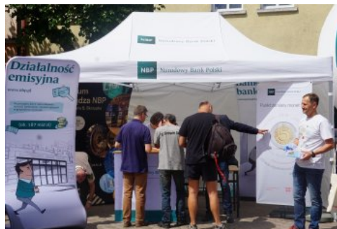
Bialo-czerwony szlak #mojaniepodległa w Polczynie- Zdroju