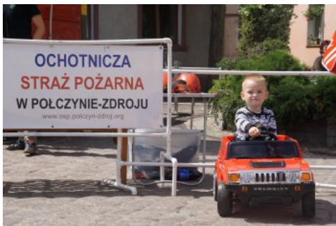
Bialo-czerwony szlak #mojaniepodległa w Polczynie- Zdroju