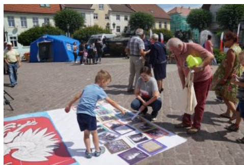
Bialo-czerwony szlak #mojaniepodległa w Polczynie- Zdroju