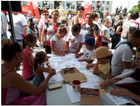
Bialo-czerwony szlak #mojaniepodległa w Barlinku