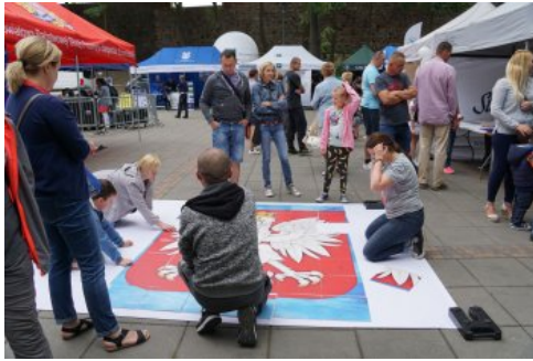
Bialo-czerwony szlak #mojaniepodległa w Stargardzie