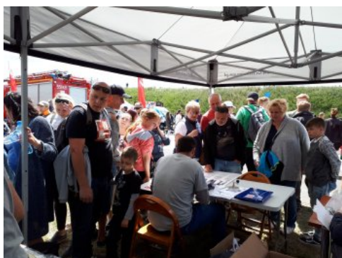
Bialo-czerwony szlak #mojaniepodległa w Świdwinie