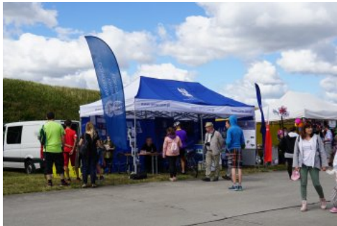
Bialo-czerwony szlak #mojaniepodległa w Świdwinie