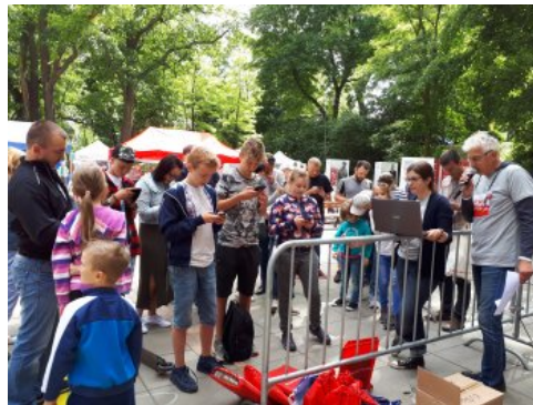
Bialo-czerwony szlak #mojaniepodległa w Stargardzie