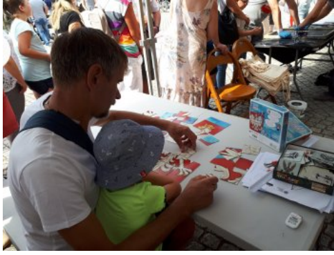
Bialo-czerwony szlak #mojaniepodległa w Barlinku