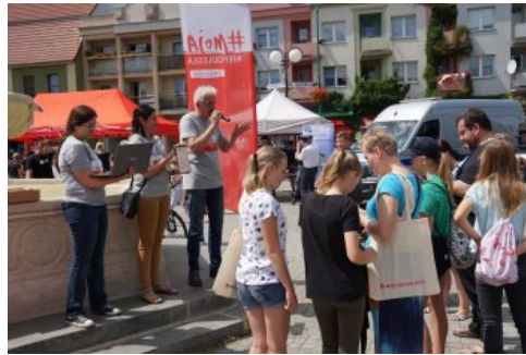
Bialo-czerwony szlak #mojaniepodległa w Barlinku