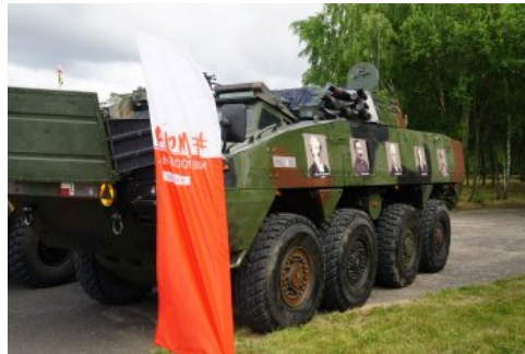
Bialo-czerwony szlak #mojaniepodległa w Świdwinie