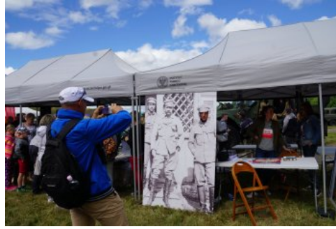
Bialo-czerwony szlak #mojaniepodległa w Świdwinie