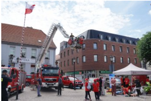
Bialo-czerwony szlak #mojaniepodległa w Polczynie- Zdroju