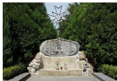
Pomnik żołnierzy zamordowanych i poległych pod Lemanem na cmentarzu w Kolnie