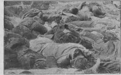
Ważeli do nieświół, rzeźbieni i wyrzuceni szablami we wsi Lemanie, ziemi łomżyńskiej pow. kolneńskiego: 1 oficer, 60 p. p., 37 żołnierzy i 5 cywilnych z II-go baonu Kowieskiego p. p. dnia 25-go lipca 1920 roku. Pochowani zostali przez ludność m. Kofna.

Reprodukcje zdjęć żołnierzy poległych pod Lemanem opublikowane w „Tygodniku Ilustrowanym”, nr 39 z 25 IX 1920 r.