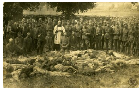
Ciała polskich żołnierzy zamordowanych i poległych pod Lemanem na cmentarzu w Kolnie, sierpień 1920 r. (autor: Stefan Mroczkowski, fot. z zasobu IPN)