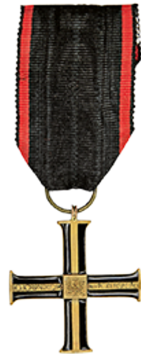
krzyż wolności i niepodległości