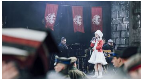
Fot. Stanisław Loba