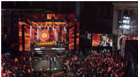
Fot. Stanisław Loba