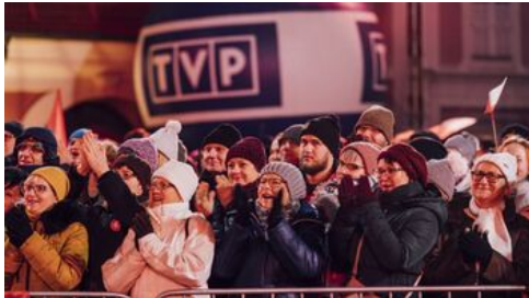
Fot. Stanisław Loba