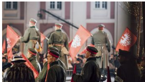
Fot. Stanisław Loba