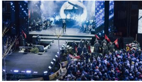
Fot. Stanisław Loba