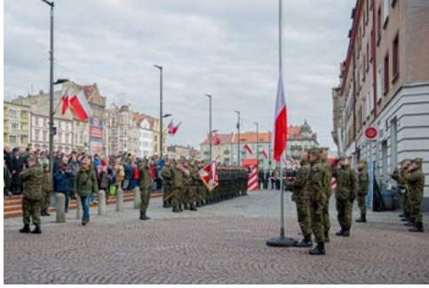
100 lat temu Korfanty został komisarzem plebiscytowym.