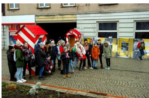
100 lat temu Korfanty został komisarzem plebiscytowym.