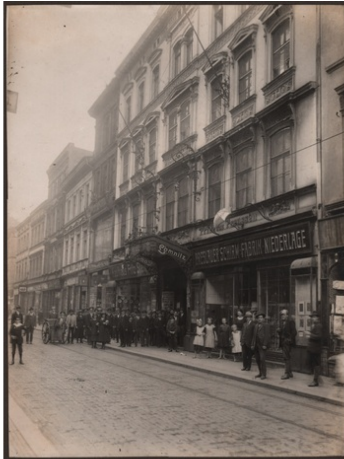
Hotel „Lomnitz” w Bytomiu (Archiwum Archidiecezjalne w Katowicach).