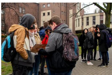
100 lat temu Korfanty został komisarzem plebiscytowym.