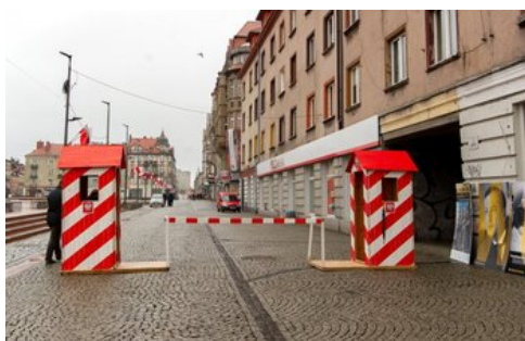
100 lat temu Korfanty został komisarzem plebiscytowym. Fot. Archiwum UM Bytom/Hubert Klimek.

Wojciech Korfanty jako polski komisarz plebiscytowy (Archiwum Archidiecezjalne w Katowicach).