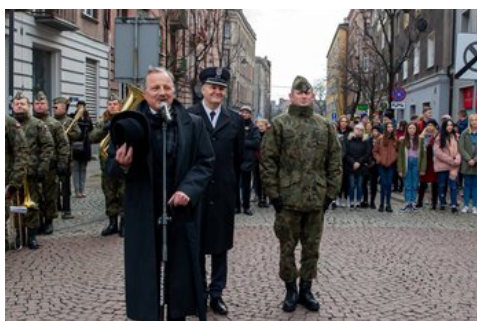
100 lat temu Korfanty został komisarzem plebiscytowym.