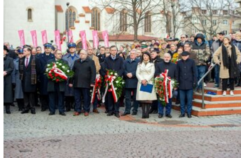
100 lat temu Korfanty został komisarzem plebiscytowym.