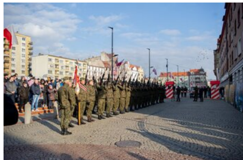
100 lat temu Korfanty został komisarzem plebiscytowym.