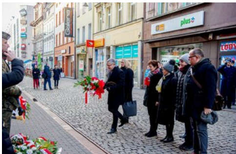
100 lat temu Korfanty został komisarzem plebiscytowym.