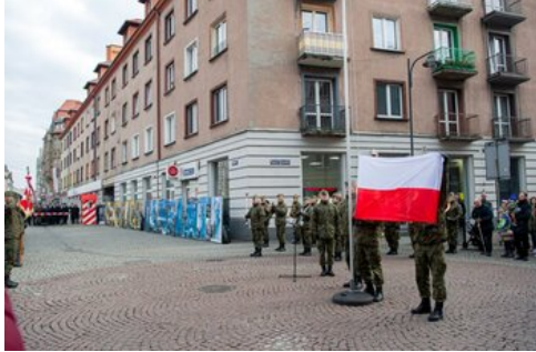
100 lat temu Korfanty został komisarzem plebiscytowym.