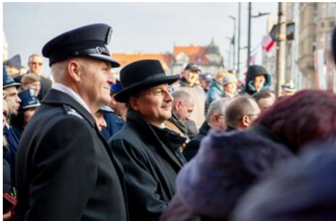
100 lat temu Korfanty został komisarzem plebiscytowym.