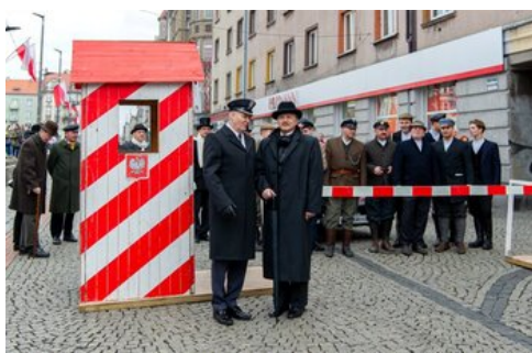
100 lat temu Korfanty został komisarzem plebiscytowym.