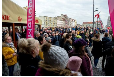
100 lat temu Korfanty został komisarzem plebiscytowym.