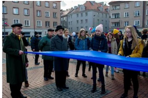
100 lat temu Korfanty został komisarzem plebiscytowym.