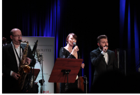
„Lata dwudzieste, lata trzydzieste...” - koncert szlagierów z okresu II Rzeczypospolitej w aranżacjach jazzowych - Warszawa, 29 października 2018.