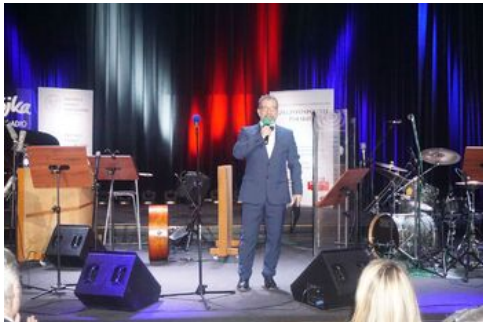
„Lata dwudzieste, lata trzydzieste...” - koncert szlagierów z okresu II Rzeczypospolitej w aranżacjach jazzowych na stulecie odzyskania przez Polskę niepodległości - Warszawa, 29 października 2018