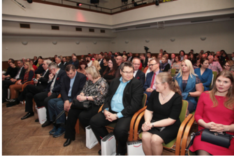
„Lata dwudzieste, lata trzydzieste...” - koncert szlagierów z okresu II Rzeczypospolitej w aranżacjach jazzowych - Warszawa, 29 października 2018.