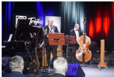
„Lata dwudzieste, lata trzydzieste...” - koncert szlagierów z okresu II Rzeczypospolitej w aranżacjach jazzowych na stulecie odzyskania przez Polskę niepodległości - Warszawa, 29