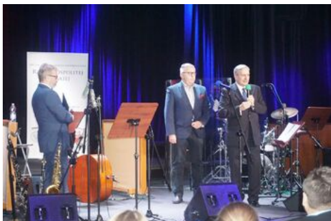
„Lata dwudzieste, lata trzydzieste...” - koncert szlagierów z okresu II Rzeczypospolitej w aranżacjach jazzowych na stulecie odzyskania przez Polskę niepodległości - Warszawa, 29