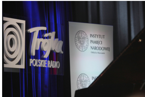
„Lata dwudzieste, lata trzydzieste...” - koncert szlagierów z okresu II Rzeczypospolitej w aranżacjach jazzowych - Warszawa, 29 października 2018.