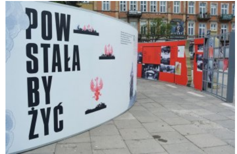
Wystawa IPN „Powstała, by żyć” - Kielce, 1-24 maja 2019