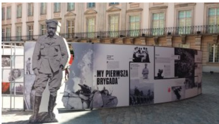
Wystawa IPN „Powstała, by żyć” na dziedzińcu Zamku Królewskiego w Warszawie (2018)