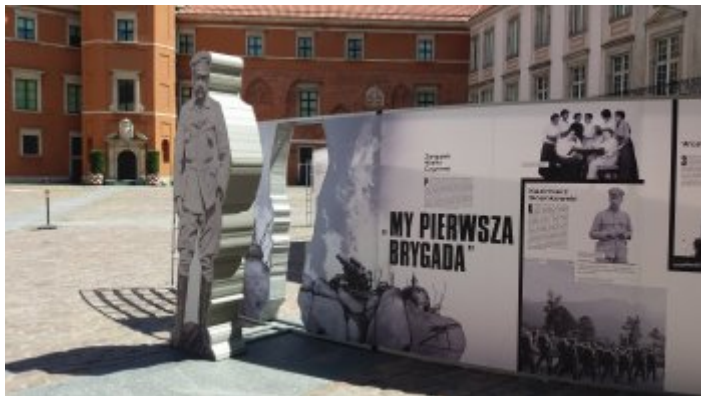
Wystawa IPN „Powstała, by żyć” na dziedzińcu Zamku Królewskiego w Warszawie (2018)