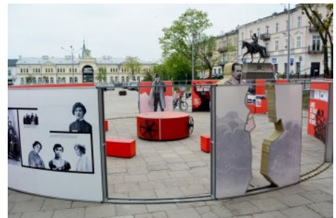
Wystawa IPN „Powstała, by żyć” - Kielce, 1-24 maja 2019