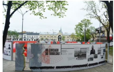
Wystawa IPN „Powstała, by żyć” - Kielce, 1-24 maja 2019