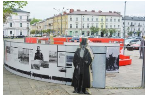
Wystawa IPN „Powstała, by żyć” – Kielce, 1-24 maja 2019