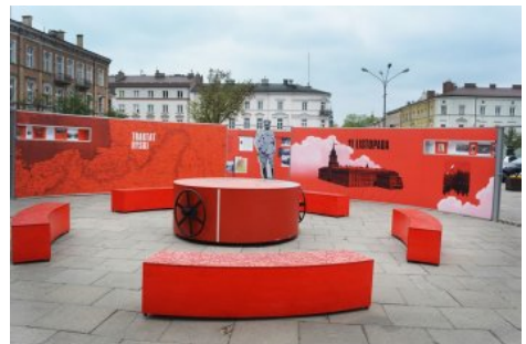
Wystawa IPN „Powstała, by żyć” – Kielce, 1-24 maja 2019