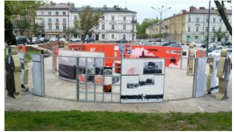
Wystawa IPN „Powstała, by żyć” – Kielce, 1-24 maja 2019