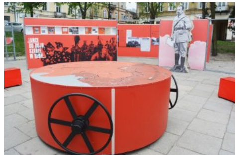
Wystawa IPN „Powstała, by żyć” – Kielce, 1-24 maja 2019