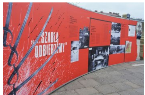
Wystawa IPN „Powstała, by żyć” – Kielce, 1-24 maja 2019