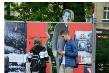
29 maja 2019. Otwarcie wystawy „Powstała, by żyć” w Krakowie