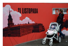
29 maja 2019. Otwarcie wystawy „Powstała, by żyć” w Krakowie

Na wystawie prezentowane są archiwalne zdjęcia, plakaty i mapy, którym towarzyszą cytaty z wypowiedzi uczestników ówczesnych wydarzeń, m.in. Naczelnika Państwa Józefa Piłsudskiego i premiera Wincentego Witosa.