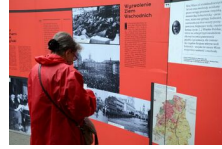
29 maja 2019. Otwarcie wystawy „Powstała, by żyć” w Krakowie