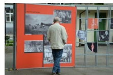
29 maja 2019. Otwarcie wystawy „Powstała, by żyć” w Krakowie