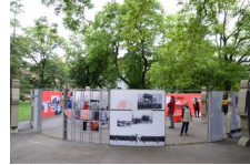
29 maja 2019. Otwarcie wystawy „Powstała, by żyć” w Krakowie