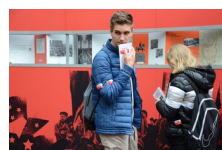
29 maja 2019. Otwarcie wystawy „Powstała, by żyć” w Krakowie