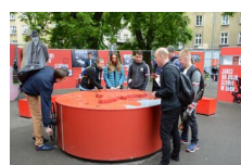
29 maja 2019. Otwarcie wystawy „Powstała, by żyć” w Krakowie