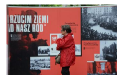
29 maja 2019. Otwarcie wystawy „Powstała, by żyć” w Krakowie