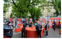
29 maja 2019. Otwarcie wystawy „Powstała, by żyć” w Krakowie