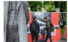
29 maja 2019. Otwarcie wystawy „Powstała, by żyć” w Krakowie