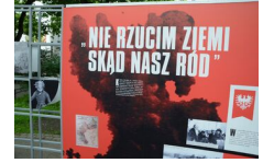
29 maja 2019. Otwarcie wystawy „Powstała, by żyć” w Krakowie