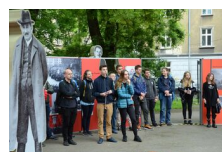
29 maja 2019. Otwarcie wystawy „Powstała, by żyć” w Krakowie