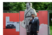
29 maja 2019. Otwarcie wystawy „Powstała, by żyć” w Krakowie