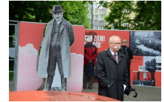
29 maja 2019. Otwarcie wystawy „Powstała, by żyć” w Krakowie