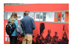
29 maja 2019. Otwarcie wystawy „Powstała, by żyć” w Krakowie