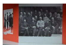
29 maja 2019. Otwarcie wystawy „Powstała, by żyć” w Krakowie