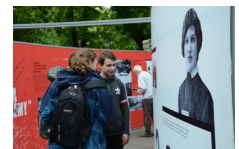
29 maja 2019. Otwarcie wystawy „Powstała, by żyć” w Krakowie