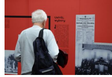
29 maja 2019. Otwarcie wystawy „Powstała, by żyć” w Krakowie