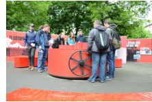
29 maja 2019. Otwarcie wystawy „Powstała, by żyć” w Krakowie