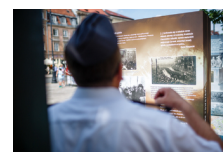
Otwarcie wystawy IPN „...Będzie wielka albo nie będzie jej wcale. Walka o granice Polski w latach 1918-1921” - Warszawa, 26 czerwca 2019.