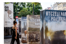
Otwarcie wystawy IPN „...Będzie wielka albo nie będzie jej wcale. Walka o granice Polski w latach 1918-1921” - Warszawa, 26 czerwca 2019.