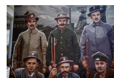
Otwarcie wystawy IPN „...Będzie wielka albo nie będzie jej wcale. Walka o granice