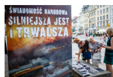
Otwarcie wystawy IPN „...Będzie wielka albo nie będzie jej wcale. Walka o granice Polski w latach 1918-1921” - Warszawa, 26 czerwca 2019.