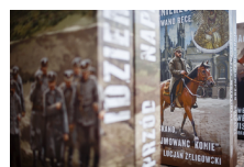
Otwarcie wystawy IPN „...Będzie wielka albo nie będzie jej wcale. Walka o granice Polski w latach 1918-1921” - Warszawa, 26 czerwca 2019.