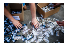
Otwarcie wystawy IPN „...Będzie wielka albo nie będzie jej wcale. Walka o granice Polski w latach 1918-1921” - Warszawa, 26 czerwca 2019.