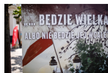
Otwarcie wystawy IPN „...Będzie wielka albo nie będzie jej wcale. Walka o granice Polski w latach 1918-1921” - Warszawa, 26 czerwca 2019.