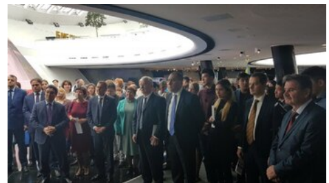
Spotkanie uczestników otwarcia wystawy z przedstawicielami IPN