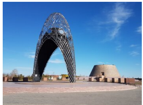
Łuk Cierpienia i muzeum upamiętniające zbrodnie sowieckie w Ałżirze