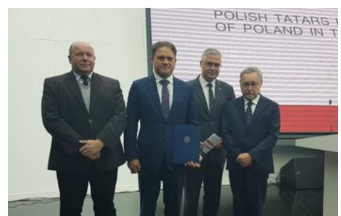
Wiceminister spraw zagranicznych Kazachstanu (drugi od lewej) po przekazaniu listu Prezesa IPN