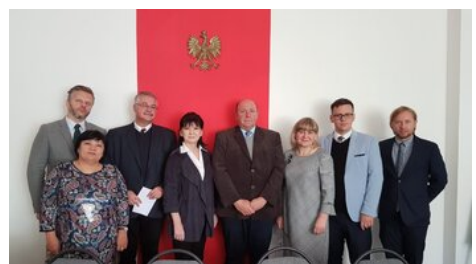
Uczestnicy spotkania w Pracowni Języka Polskiego na Uniwersytecie im. Gumilowa w