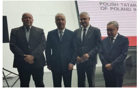
Ambasador Ukrainy (drugi od lewej) wśród organizatorów sesji i otwarcia wystawy w Astanie