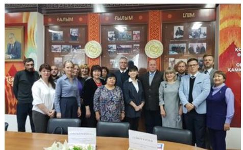
Uczestnicy spotkania z delegacją IPN