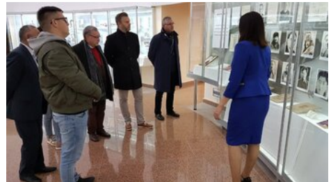
Delegacja IPN w muzeum sowieckiego ludobójstwa w Ałżirze