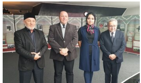
Organizatorzy sesji na tle wystawy o Tatarach