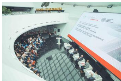
Sesja naukowa w bibliotece prezydenckiej