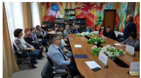
Uczestnicy spotkania z delegacją IPN, w tym przedstawiciele społeczności polskiej w Astanie